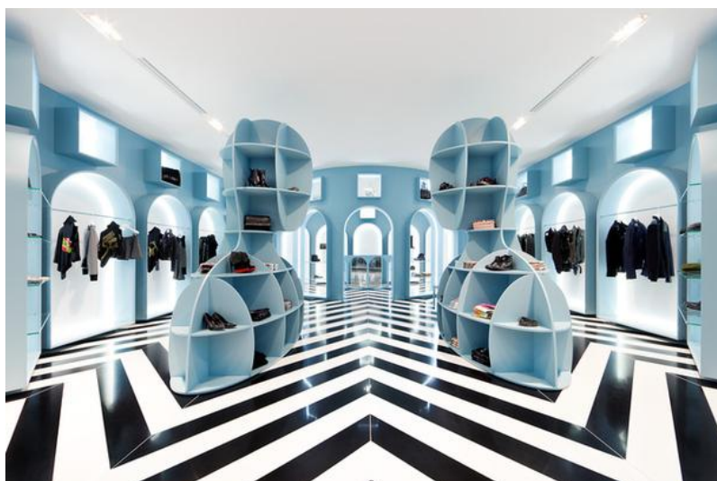
Podea specifică, din materiale contemporane

Aspectul general al pardoselei va fi corelat cu imaginea pe care comerciantul dorește să o promoveze pentru magazinul său. Magazinele alimentare, farmaciile au pardoseala albă, lucioasă, perfect netedă, cu efecte de marmură care să dea impresia de curățenie, în timp ce un magazin de mobilă sau de haine, e de preferat, să aibă o podea specifică, din materiale contemporane.