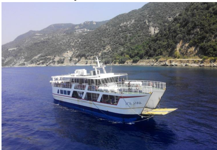
Feribotul Sfânta Anna

Muntele Athos este considerat un vestigiu religios unic pentru statele creștine ortodoxe, care devine atractiv pentru pelerini încă din epoca medievală, în exclusivitate pentru bărbați. Spațial-geografic este situat în nord-estul Greciei, în zona Macedoniei Centrale, în cadrul spațiului de Sud peninsular cu altitudinea de peste 2033 m. Lungimea peninsulei cu denumirea Chalchidice depășește 60 km, iar lățimea maximală atinge 8–12 km. Suprafața totală este de 360 km pătrați. Accesul se poate realiza odată cu obținerea vizei de ședere și doar prin intermediul mijloacelor maritime de transport de mici dimensiuni, de tip feribot, din partea de vest a portului Uranopolis sau de pe coasta de est, din portul Lerrisos.