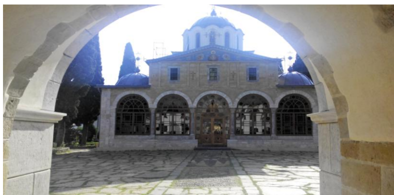
Biserica românească Sfântul Ioan Botezătorul

Edificii românești din cadrul Sfântului Munte sunt considerate Schitul „Sfântul Ioan Botezătorul”, numit și Prodromu, care aparține Sfintei Mănăstiri a Marii Lavre, de asemenea Schitul „Sfântul Dumitru Valahu”, ce aparține de Mănăstirea Sfântul Pavel.