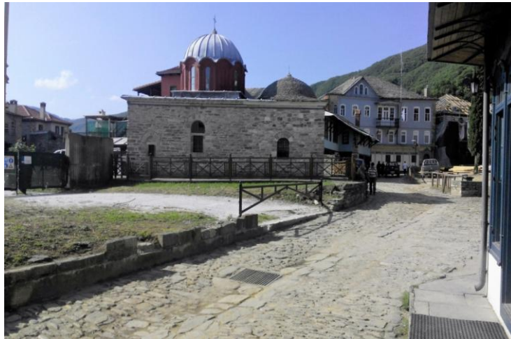
Peisaj monastic din cadrul capitalei Kareia

Mănăstirile sunt clasificate în două categorii – conservatoare, numite și cenobite, unde toate bunurile sunt utilizate ca proprietate comună, și mănăstiri idioritmice, considerate „liberale”, care acceptă și proprietatea personală asupra unor bunuri din cadrul lăcașurilor monastice. Din punct de vedere administrativ, Sfântul Munte are un statut de republică autonomă în cadrul Greciei, având edificii legislative și executive în capitala Kareia.