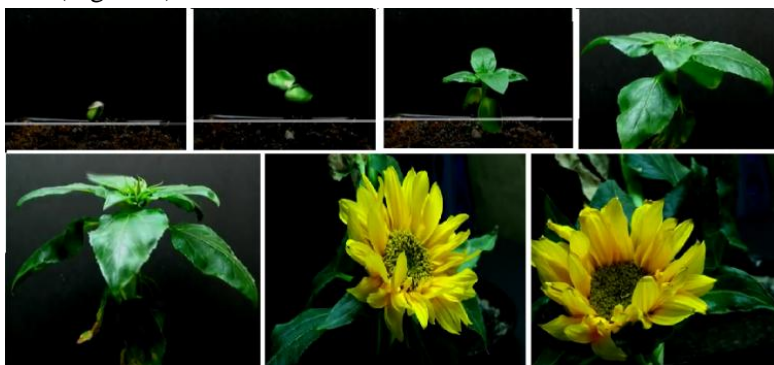
Figura 3. Video „Viața unei flori” – inclus în manual digital

Prin plasarea unui film [5] în manualul electronic, elevii, fără dificultate, pot urmări viața unei plante cu flori – floarea soarelui. (Figura 3)