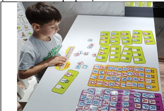
Fig. 16. „Cheia succesului” - decodificăm cuvintele ascunse după coduri numerice.

Tehnici: Logopedul poate introduce activități repetitive în timpul fiecărei sesiuni, cum ar fi numirea sunetului inițial, median sau final, cântatul sau recitarea unor poezii, pentru a consolida vocabularul și structurile de propoziție.