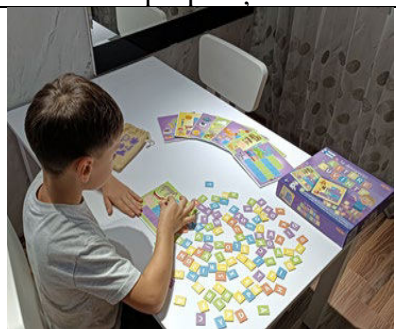
Fig. 22. „Litere și cuvinte” – explorarea literelor și a cuvintelor, stimulând curiozitatea înnăscută a copiilor, dezvoltă aptitudinile de scris și citit.

Aceste strategii sunt adaptate nevoilor fiecărui copil și sunt aplicate în mod personalizat pentru a sprijini dezvoltarea limbajului în mod optim. Logopezii monitorizează progresul și ajustează tehnicile pe parcurs, în funcție de rezultatele obținute.