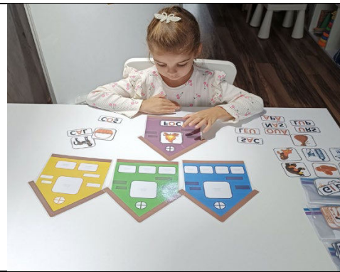
Fig. 15. „Casuțe cu silabe” - formăm cuvinte din 1, 2, 3, 4 silabe.