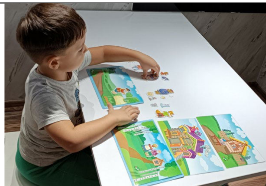
Fig. 7. Înscenarea poveștilor „Ridichea”, „Gogoșa”, „Foisorul”.