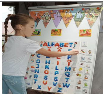
Fig. 2. „Alfabetul vesel” - depistarea sunetelor inițiale.