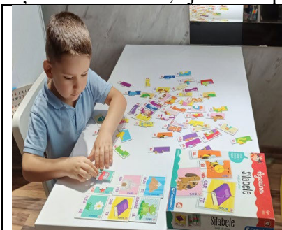
Fig. 20. „Silabele – învăț să citesc” – este o primă abordare de către copii a ortografiei și a cititului într-un mod plăcut.

Tehnici: Logopedul folosește imagini, puzzle, cărți cu imagini sau materiale vizuale care ilustrează acțiuni sau obiecte, ajutând copilul să învețe cuvinte noi și să le utilizeze în propoziții.