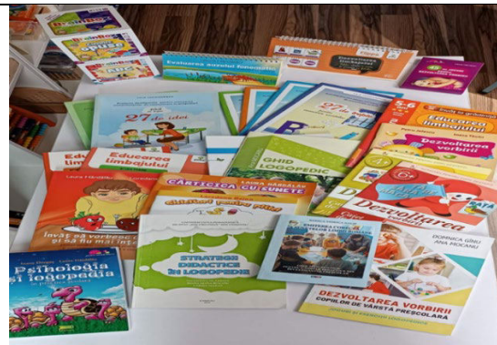
Fig. 5. Material didactic: - poezii, texte, povestioare logopedice - proiecte didactice logopedice, fișe de lucru logopedice