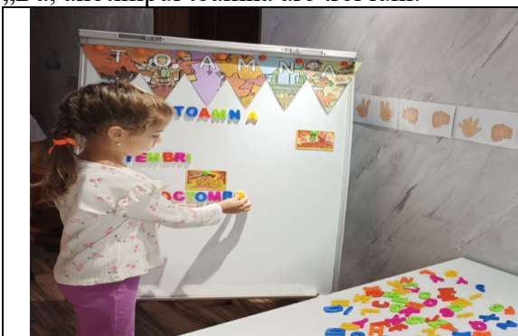
Fig. 8. Consolidarea cunoștințelor despre anotimpul toamna și lunile acesteia.

Tehnici: Logopedul va asculta propozițiile copilului și le va extinde, adăugând detalii sau corectând subtil greșelile gramaticale. De exemplu, dacă un copil spune „Trei luni”, logopedul poate răspunde „Da, anotimpul toamna are trei luni.”