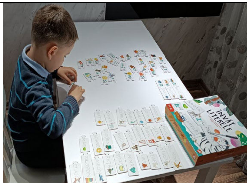
Fig. 17. „Învăț literele” – joc educativ progresiv, bazat pe corespondența dintre literele, imaginile și cuvintele.