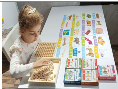
Fig. 19. „Triopuzzle” – îmbogățește vocabularul și pregătește copilul pentru cititul cursiv și pentru scris.