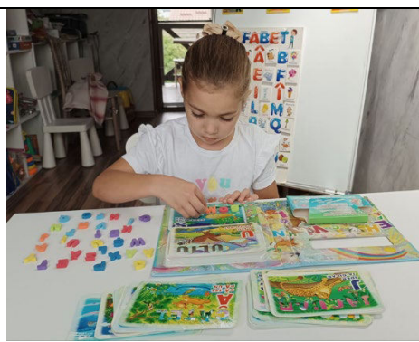
Fig. 11. „Litere și cuvinte amuzante” – carte-jucărie instructivă foarte captivantă.