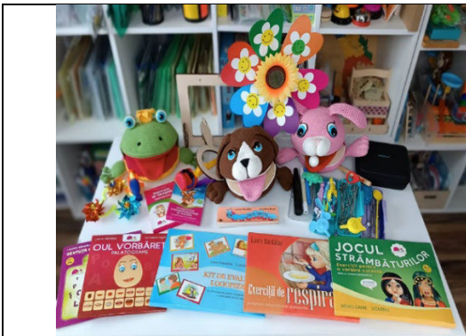
Fig. 4. Material logopedic demonstrativ-practic, pentru educarea respirației, întărirea sau relaxarea mușchilor fonoarticulatori și înlăturarea tulburărilor de pronunție.