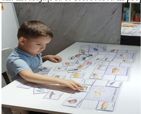
Fig. 12. Sortăm categoriile de transport (terestru, maritim și aerian).

Tehnici: Logopedul poate folosi imagini cu diferite obiecte și va încuraja copilul să le sorteze în categorii (de exemplu, „fructe”, „animale”, „obiecte din casă”). Pe măsură ce copiii învață cuvinte noi, sunt încurajați să le folosească în propoziții.