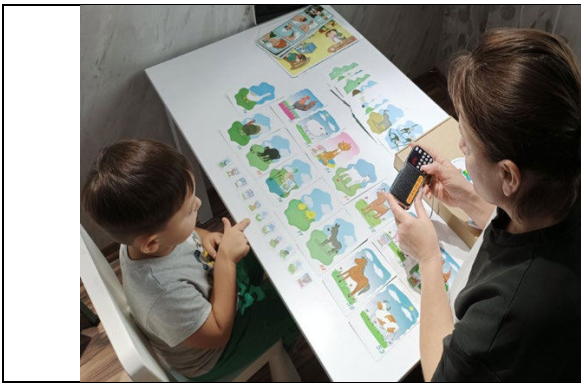
Fig. 14. „ Să ascultăm este interesant” – formarea abilităților de a distinge sunetele, de a dezvolta percepția auditivă, atenția auditivă, memoria auditivă și gândirea.