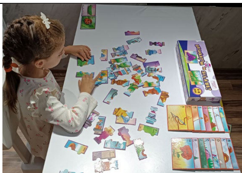
Fig. 18. „Despărțim în si-la-be!” – joc distractiv care ajută copilul să recunoască literele, să rostească și să despărțâ în silabe diferite cuvinte.