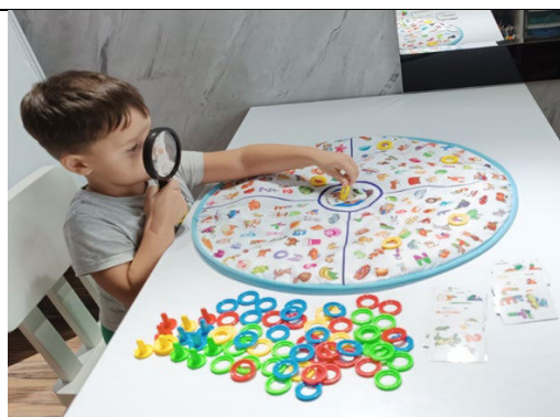
Fig. 13. „Micul detectiv” – găsim litere, cifre, diferite imagini.