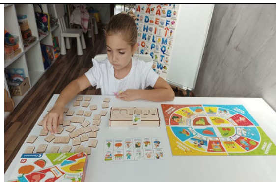
Fig. 9. Semnele celor 4 anotimpuri, formăm cuvinte - lunile anului.