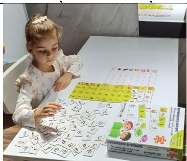
Fig. 21. „Privește și citește” – copiii învață citirea, scrierea literelor și formarea cuvintelor simple. Își dezvoltă abilitatea de a reține elementele și ulterior de a le recunoaște și plasa în context.