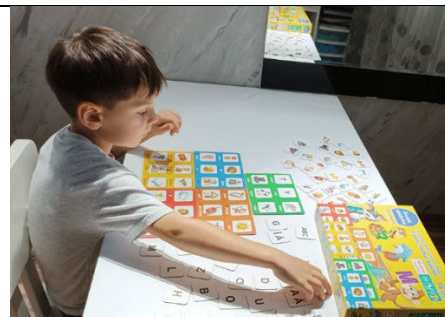
Fig. 3. „Învață alfabetul” - dezvoltarea auzului fonematic, prin corespondența dintre literă și imagine.