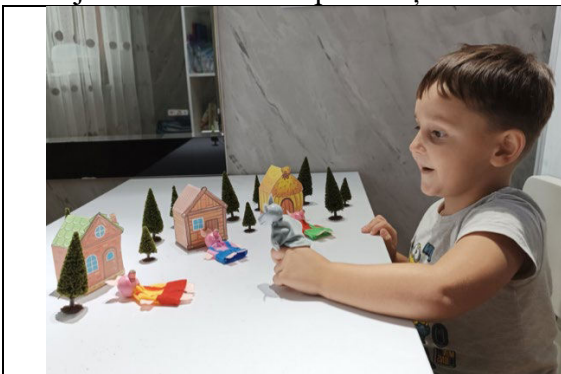
Fig. 6. Dramatizarea poveștii „Cei trei purceluși”.

Tehnici: Logopedul creează scenarii de joc de rol, precum „povești” sau „de-a doctorul”, unde copilul este încurajat să comunice, să pună întrebări și să răspundă. Acest lucru stimulează utilizarea limbajului într-un mod spontan și creativ.