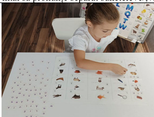
Fig. 10. „Alfabetar” – învățăm literele și formăm cuvinte scurte.

Tehnici: Dacă un copil are dificultăți în pronunția unui sunet complex, logopedul îl va învăța să articuleze sunetele din cuvânt pas cu pas. De exemplu, pentru cuvântul „cățel”, copilul poate învăța mai întâi să pronunțe separat sunetele /c/, /ă/ și /țel/.