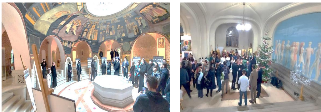
Figura 3. Vernisajele unor expoziții ale Secției Artă Sacră [8]

Studentii sunt încurajați, de asemenea, să participe la manifestările științifice studențești și să urmeze stagiile de practică oferite prin programul de mobilități Erasmus + [9].