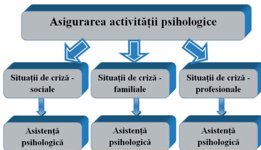
Modelul general al asigurării activității psihologice