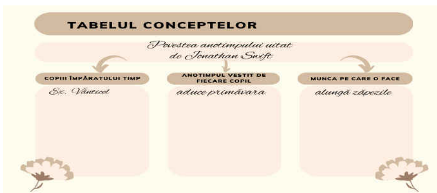
Fig. 2. Tabelul conceptelor- Povestea anotimpului pierdut

Etapa lecturilor succesive cuprinde trei secvențe: înțelegerea, analiza și interpretarea textului. Prima lectură este foarte importantă, deoarece este „momentul a cărui calitate determină fundamental înțelegerea, analiza și interpretarea întregului text.” Aceasta se poate realiza prin: lectura continuă/ discontinuă a textului, lectura neorientată/ orientată, lectura realizată de învățător/ de elevi (lectura cu voce tare sau silențioasă) [6, p. 281]. Tot în această etapă se realizează prima relectură care are rolul de a aprofunda înțelegerea textului. Odată realizată, aceasta se trece la analiza și la interpretarea textului prin lecturi succesive. În această etapă, pentru eficientizarea învățării, cadrul didactic poate folosi următoarele metode și tehnici de lucru: harta textului, harta personajelor, tehnica „desenului din covor”, explozia stelară, cubul, metoda cadranelor, tabelul conceptelor, jocul de rol, diagrama Venn, jurnalul cu dublă intrare etc.