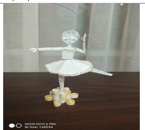
Figura 5. Balerina din povestea Soldățelul de plumb

Învățarea centrată pe elev oferă elevilor o mai mare autonomie și un control sporit cu privire la disciplina de studiu, la metodele de învățare și la ritmul de studiu. Iar predarea interdisciplinară pune accentul simultan pe aspectele multiple ale dezvoltării copilului: intelectuală, emoțională, socială, fizică și estetică. În cele din urmă, interdisciplinaritatea asigură forma sistematică și progresivă a unei culturi comunicative necesare elevului în învățare, pentru interrelaționarea cu semenii, pentru parcurgerea cu succes a treptelor următoare în învățare, pentru învățare permanentă. Prin interdisciplinaritate, profesorul dezvoltă abilități, modelează personalități necesare societății cu gândire critică, capacitate de comunicare și cooperare, abilități de lucru în echipă, atitudine pozitivă, responsabilitate și implicare.