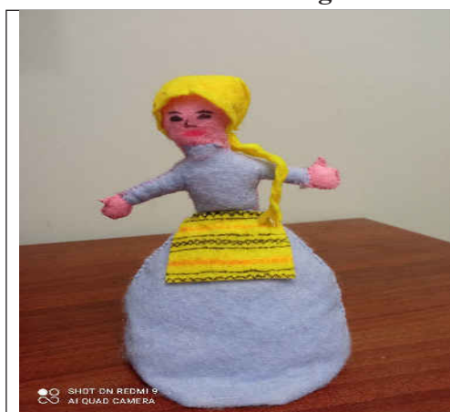
Figura 4. Proiectul Personajul meu preferat din poveste. Fata moșneagului