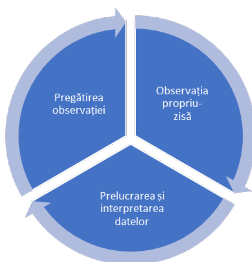
Fig. 1. Etape distincte ale procesului de observare [2]

Instrumentele de înregistrare și sistematizare cele mai frecvent folosite sunt [1]: