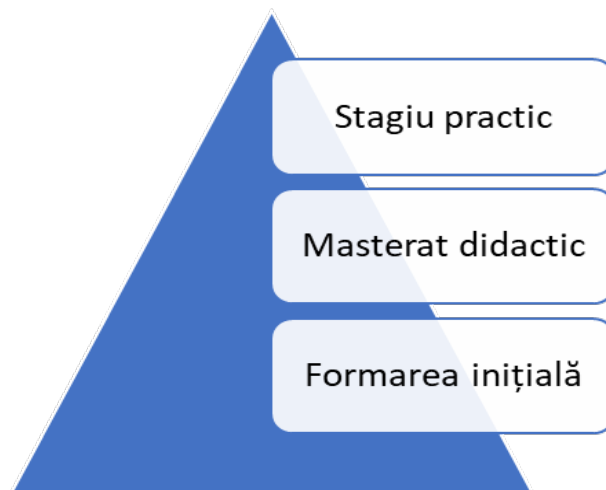
Fig. 2. Elemente ale formării inițiale a cadrelor didactice

eficiente pentru asistarea debutanților în perioada de stagiatură și pentru acreditarea programelor de formare a mentorilor de inserție din învățământul preuniversitar. Implementarea mentoratului în practică este esențială pentru îmbunătățirea integrării și sprijinirii debutanților în cariera didactică pe parcursul perioadei de stagiatură. De asemenea, dezvoltarea unui sistem național de formare pentru mentorii de inserție profesională și asistența adecvată a debutanților în perioada de stagiatură sunt imperative pentru îmbunătățirea învățământului preuniversitar [4].