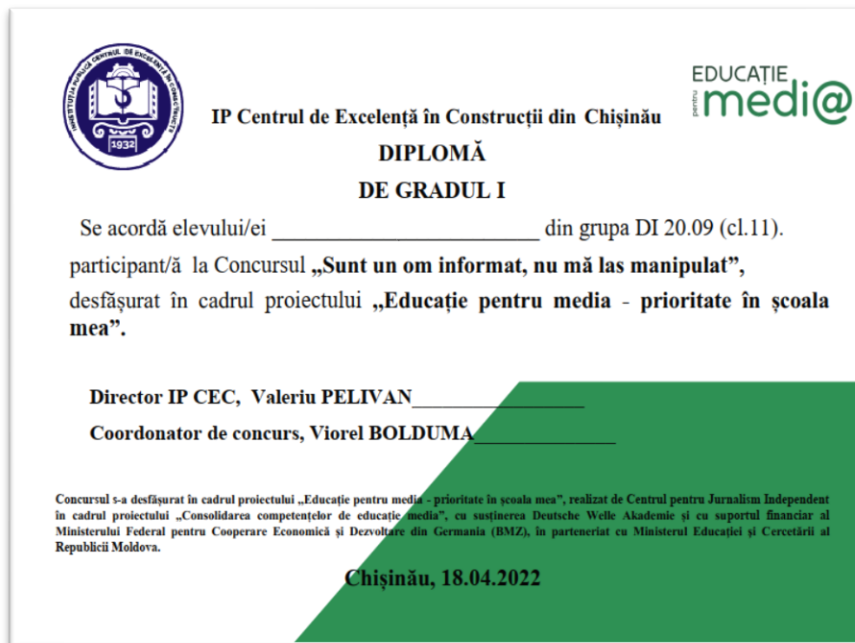
Fig. 7. Diploma concursului „Sunt un om informat, nu mă las manipulat”. Model de diploma pentru participanți.