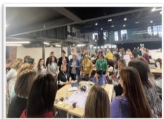
Foto 7. Prezentarea produsului după I etapă Membrii echipei de proiect din LT „Gr.Vieru” și alte instituții din țară, sediul Tekwill, Chișinău, 27 noiembrie, 2022, (sursa facebook Liceul Teoretic Grigore Vieru).

În cadrul lecțiilor de geografie, elevii vor stabili anumite zone geografice ale țării, ale comunității, ale mediului școlar populate cu etnii și conviețuirea acestora. Matematica va aborda elaborarea statisticilor, informatica va oferi posibilitatea să fie prezentate cercetările în anumite aplicații digitale. Mai nou, în contextul implementării competenței interculturale prin digital figurează disciplinele opționale din cadrul programului „Tekwill în fiecare școală” – Proiectarea și Dezvoltarea Aplicațiilor Mobile, Design Grafic, Inteligența Artificială, Antreprenorat, Proiectarea și Dezvoltarea Web, care oferă oportunitate elevilor să prezinte date, diagrame, să aranjeze imagini, să proiecteze anumite aspecte de cercetare în variantă digitală, explorând în paralel competența interculturală cu ce digitală.