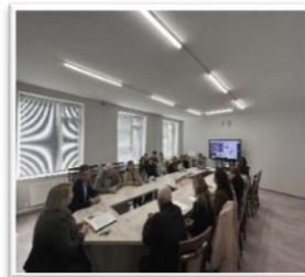
Foto 3. Etapa a II-a de implementare a Programului „Școala digitală”, matematică, Sediul Tekwill, Sediul Tekwill, Chișinău, 26 august 2022, (sursa facebook Liceul Teoretic „Grigore Vieru” )

Activitățile ce urmează a fi dezvoltate în contextul intercultural sunt gândite din start prin prisma digitalului, întrucât inițiativa „Școala digitală” oferă oportunitate membrilor comunității școlare din rândul cadrelor didactice să participe la formări cu mentorii, cu Ambasadorii digitali ai programului, cu experți pentru a explora și a învăța aplicații, platforme, ulterior a le implementa în activitatea educațională. Dacă, inițial, au fost înscriși în echipa de proiect 5 cadre didactice de la Comisia metodică – „Matematică și științe”, atunci, pentru elaborarea unui produs ca urmare a unei activități ce vizează competența interculturală, au fost cooptate cadre didactice de la disciplinele umaniste: limba și literatura română, limba engleză, educație pentru societate, istoria românilor și universală, geografie. După programul de mentorat în baza noii abordări a educației OECD Learning Compass – Busola Învățării de o săptămână în luna august 2022 cu expertul internațional Gay Levi, în cadrul Tekwill Moldova, am învățat cum să elaboram un MVP (Minimal Viable Product) într-un timp scurt și ne-am schițat un model, acesta constituind un răspuns imediat la cerințele societății, în care se vor încadra tinerii de succes.