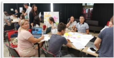
Foto 2. Activități de formare privind implementarea Programului „Școala digitală”, Caduc Aliona Masa rotundă – administrația, elevi, Chișinău, 24 iunie, 2022.