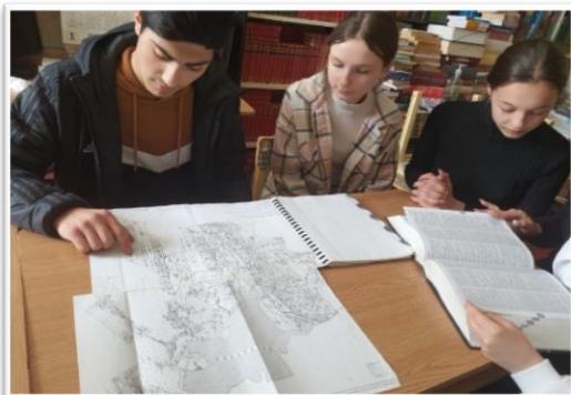
Foto 4. Arhiva primăriei. Echipa de proiect. Aprilie 2022. Autor Iachimovschi Nadejda

În arhivă elevii au studiat procesul de colectivizare din Nisporeni 7 . Au identificat primii președinți de colhoz și, de la rude, au colectat poze. Au găsit actele de stat pentru folosință veșnică a pământului de către colhozurile „Miciurin” 8 și „Șvernici” și informații referitoare la volumul de teren arabil, vie, livadă ce-l avea fiecare. Au văzut harta integrală a pământului din localitatea Nisporeni din acele timpuri.