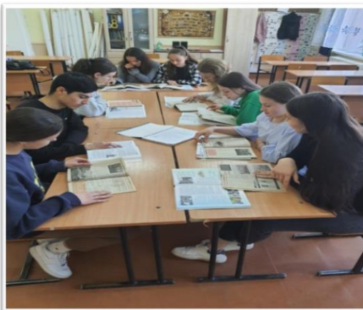
Foto 15. Studierea articolelor. Aprilie 2022.

După discuții despre ororile provocate de regimul stalinist, elevii au fost interesați de a studia evenimentele de nivel național și local, și s-au arătat implicați emoțional să afle relațiile martorilor oculari despre evenimentele tragice produse în localitatea Nisporeni. Pentru a asigura o maximă implicare, am creat posibilitatea ca fiecare elev să-și aleagă o direcție de studiu și să informeze mai târziu despre evenimentele cercetate.