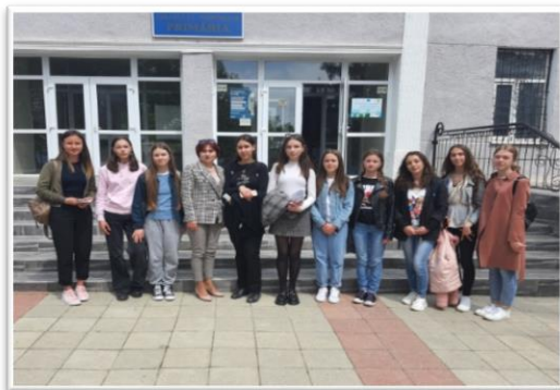
Foto 3. Primăria orașului Nisporeni. Echipa de proiect. Aprilie 2022.

În multitudinea de izvoare de cercetare și documentare, arhiva constituie o sursă sigură de date istorice stocate în timpul perioadei respective. Pentru prima dată elevii au avut posibilitatea să cerceteze pe viu documentele arhivate și de aceea trăirile lor erau multiple: de curiozitate, interes, bucurie, dar și de empatie pentru suferința trăită de înaintașii noștri 6 .