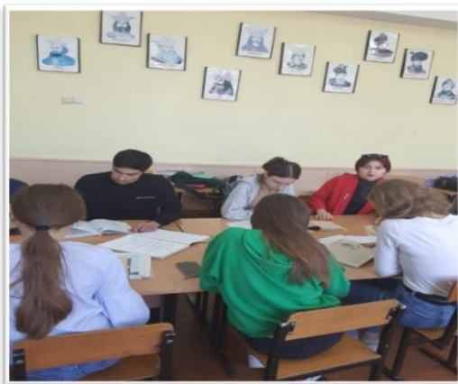
Foto 14. Masă rotundă. Echipa de proiect. Aprilie 2022.

O altă activitate realizată a fost masa rotundă, care a fost selectată din considerentul că este o metodă eficientă de lucru cu discipolii, ce permite fiecărui participant la discuție să-și expună informația și punctul de vedere, totodată creând condiții favorabile de a dezvolta o comunicare eficientă, empatică.