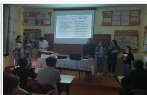
Foto 16, 17. Prezentarea proiectului publicului. Mai 2022