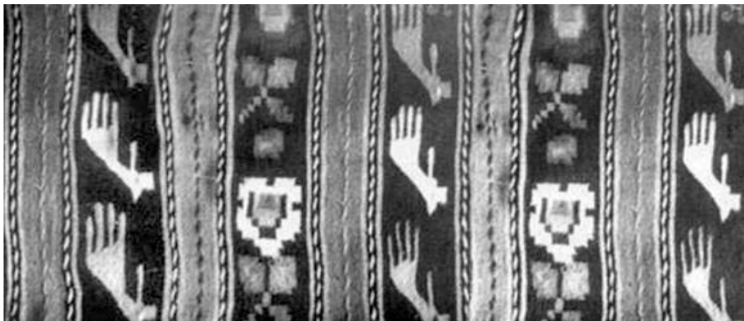
Fig. 12. Imaginea mâinii pe un lăicer din Văratec.

frumusețea uniforme și zveltețea trupului călărețului. Cât despre motivele antropomorfe feminine, în cele mai variate reprezentări ele semnifică cultul fertilității și al feminității.