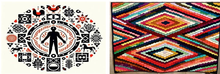
Fig. 2. Simboluri în arta ornamentală