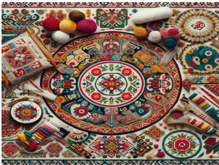
Fig. 16. Motive decorative pe țesături