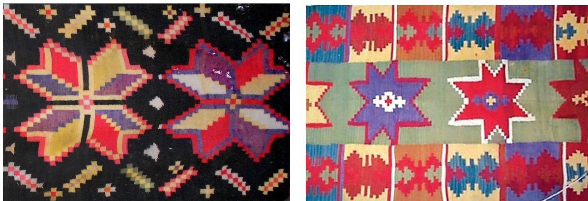
Fig. 15. Detaliu ornamental. Motive astrale