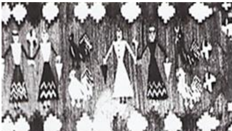
Fig. 9 Detaliu de scoară cu fete și cocoși. Muzeul Etnografic din Iași.

Cel mai frecvent întâlnim figuri feminine și masculine, care, prin repetiția înlănțuită, au creat acel frumos ritm de horă , iar atunci când sunt înșiruite, dau aceeași impresie de dans. Motivul horei pe țesături este inspirat din binecunoscuta Horă de la Frumușica – operă de artă bidimensională, reprezentând un suport antropomorf compus din șase statuete feminine, văzute din spate, înlănțuite, parcă, într-o horă . Izvoarele arheologice afirmă că în societățile matriarhale se practica, pe lângă cultul zeiței-mamă și cultul solar, iar hora , ca reprezentare circulară vie, ar putea fi elementul de legătură dintre ele, ca expresie a unui ritual solar de fertilitate [69]. Cercetătorii consideră că dansul în sine este o formă de existență a societăților primitive, poate chiar expresia prelingvistică a sufletului arhaic care, prin mișcările ritmice ale corpului, „își exteriorizează trăiri și impulsuri esențiale” [29, p. 24].