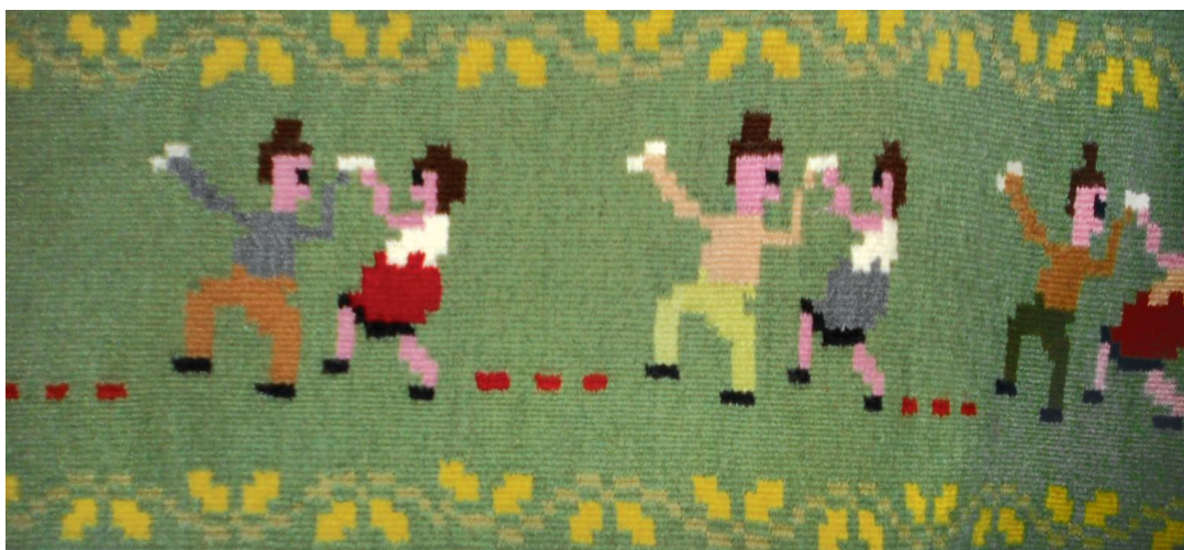
Fig. 14. Detaliu de păretar. Motive antropomorfe.