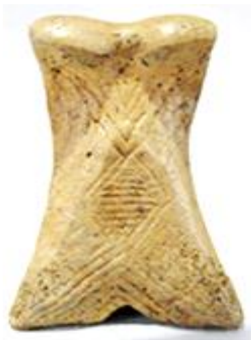
Fig. 3. Reprezentarea rombului pe falanga de ecvideu din cultura Cucuteni Tripolie.

Rombul , este unul din cele mai vechi și mai frecvente motive ornamentale ale artei populare naționale și universale, motiv cu cele mai multe reprezentări și semnificații, indiferent de obiectul pe care este reprezentat. Este elementul decorativ aflat în cea mai directă comunicare cu tradiția, supraviețuind, prin mecanismele conservatoare ale inerțiilor stilistice și tehnice, unul dintre motivele primare, originare, pe care-l găsim la începuturile artei universale.