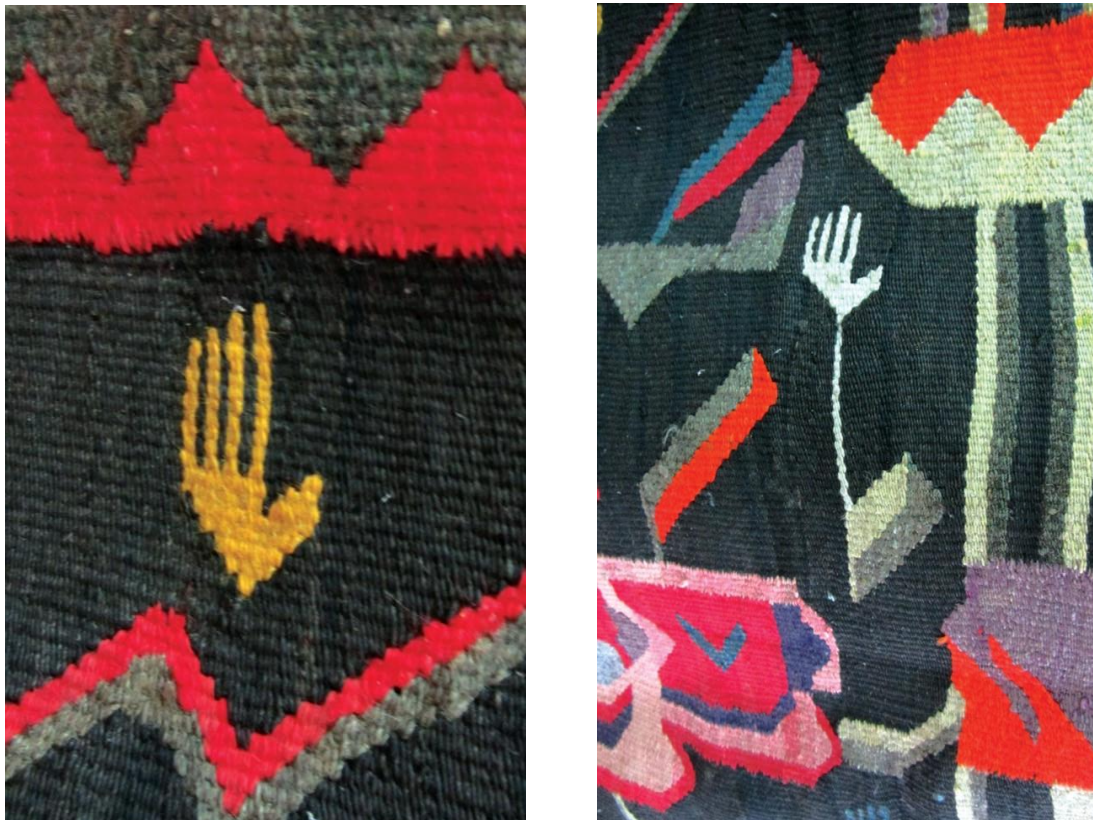
Fig. 13. Mâna. Detaliu ornamental.