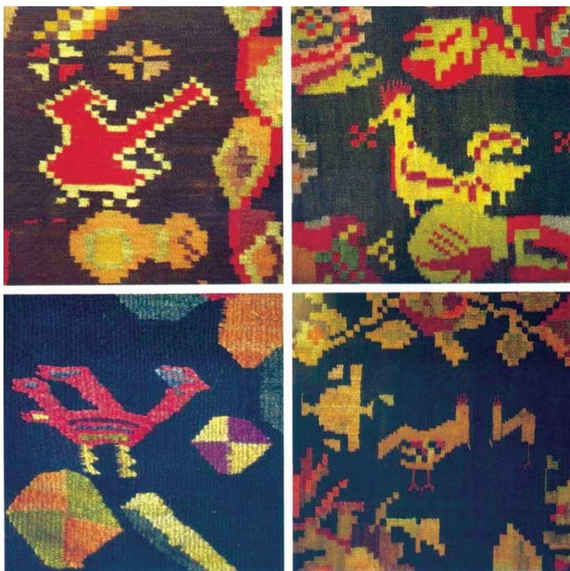
Fig. 5. Motive avimorfe. Detalii ornamentale