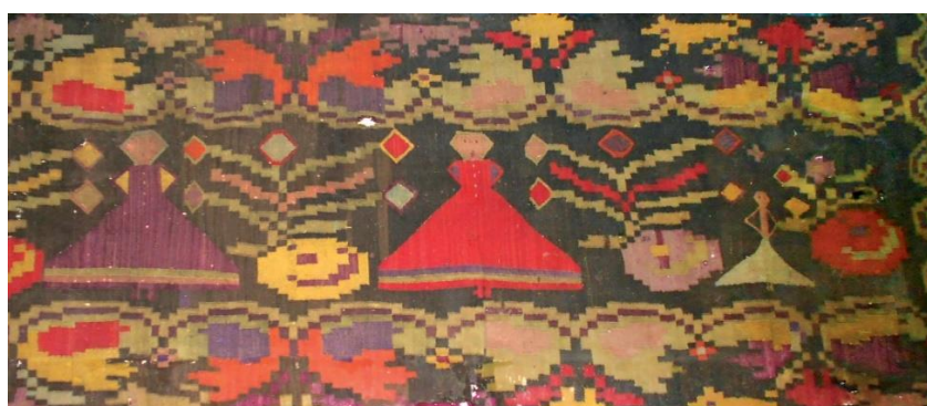
Fig.7. Covorul Păpușile, sec. al XVIII-lea. MNEIM.

Frecvent remarcate sunt ornamente antropomorfe precum: hora , hora femeilor , jocul băieților , mâna , călărețul trac . De cele mai multe ori, aceste motive decorative se întâlnesc în ipostaze atât statice cât și dinamice: siluete de femei și bărbați apar ținându-se de mână, în horă, călare, ținând umbrele în mâini, sau cu mâinile ridicate, având crenguțe înflorate. Uneori, de dimensiuni mici, alături de motivele principale, observăm imaginea singulară a femeii. De obicei, aceasta reprezintă un autograf al autoarei celei care a executat țesătura, ori poate fi o semnătură de apartenență a obiectului etc.