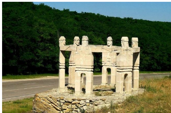
Fig.11. Compoziția sculpturală Hora haiducilor , amplsată pe traseul Chișinău-Strășeni.

Un exemplu interesant îl constituie scoarța cu perechi de fete ce alternează cu cocoși, păuni și pomi, lucrată la începutul secolului XX, aflată în colecția Muzeului Etnografic din Iași. Acesta redă două fete în ținută de oraș – cu fustă clopot, cu mâinile unite pentru a ține un pomușor, iar în cealaltă mână poartă câte o umbreluță. Considerăm că prezenta cocoșilor substituie funcția bărbaților.