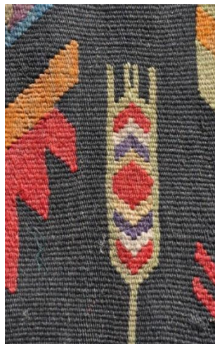
Fig. 4. Detalii ornamentale. Bujorul și spicul de grâu.