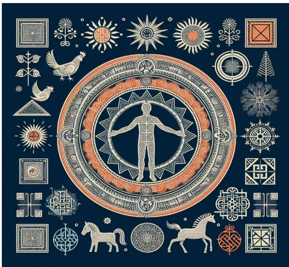
Fig. 1. Omul ca ființă simbolică

Alegeți un simbol specific care vă interesează și realizați un proiect de cercetare aprofundat. Consultați diverse surse bibliografice, analizați interpretări din diferite perspective și prezentați concluziile Dvs. într-un eseu, o prezentare sau o altă formă de comunicare.