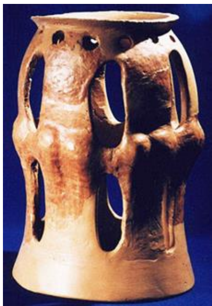
Fig. 8. Hora de la Frumușica

Deseori, printre motivele amintite mai sus întâlnim schițate și elemente skeomorfe: furca de tors , plugul , pieptenele , masa , scaunul , lada de zestre , scara , furculița , păhăruțele , geamurile , casa , ancora , monograme cu indicarea inițialelor , anul confecționării , imagini legate de anumite atribute și ritualuri de nuntă ( colacul mirelui , coronița miresei , colacul miresei , jămnele , cununile , numele mirilor etc. Dintre acestea remarcăm furca de tors , considerată simbol al feminității, al iscusinței manuale. În trecut, furca de tors era asociată femeilor nemăritate, iar lăna, se asocia cu prosperitatea, bogăția, fecunditatea. În concepția tradițională, furca de tors este un atribut