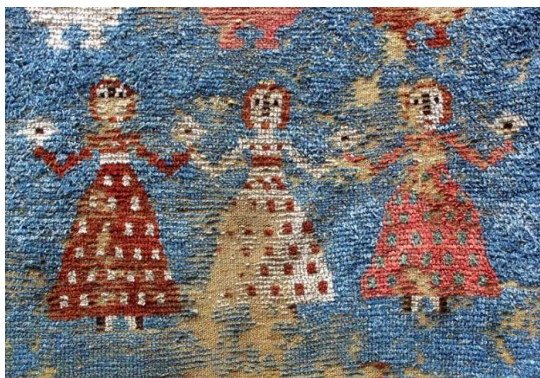
Fig. 10. Detaliu din cerga Hora femeilor , sec. al XVIII-lea. S. Mateuți, r. Rezina.

Semnificațiile ei arhaice se evidențiază în acea adevărată contopire harică a jucătorilor cu divinitatea tutelară prezentă, parcă, în centrul cercului. Bătăile ritmice cu piciorul în pământ pot simboliza contactul teluric cu suportul material oferit de Zeița-Mamă, iar strigăturile și chiuiturile amintesc de acele incantații magice către zei. Conform mitologului R. Vulcănescu „în mentalitatea arhaică, această stare similară celei de magie euritmă echivala cu o contopire totală a membrilor colectivității cu divinitatea ancestrală din centrul horei, Zalmoxes, zeu al morții și al învierii, un tulburător punct de intersecție cu creștinismul“ [69, p. 63]. Elemente relictuale ale horei ezoterice s-au transmis până astăzi prin dansul călușului.