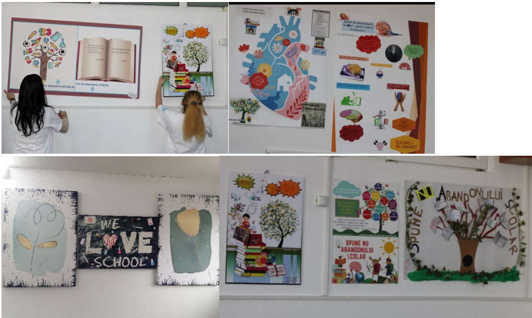
Figura 3. Afișe și postere realizate în cadrul proiectului “Arta fotografică în domeniul științelor”

Cea de-a treia etapă a fost constituită de realizarea de afișe și postere care au conținut trimiteri la tematica proiectului, promovând mesaje cu impact pozitiv (“We love school!”), care să trezească simțământul de includere chiar și în rândul celor mai vulnerabili elevi, acestea fiind tipărite și afișate pe holurile școlii, în clase, pe pagina de Facebook și pe pagina web a școlii și s-au realizat fotografii care au fost încărcate pe platforma eTwinning, la pagina proiectului.