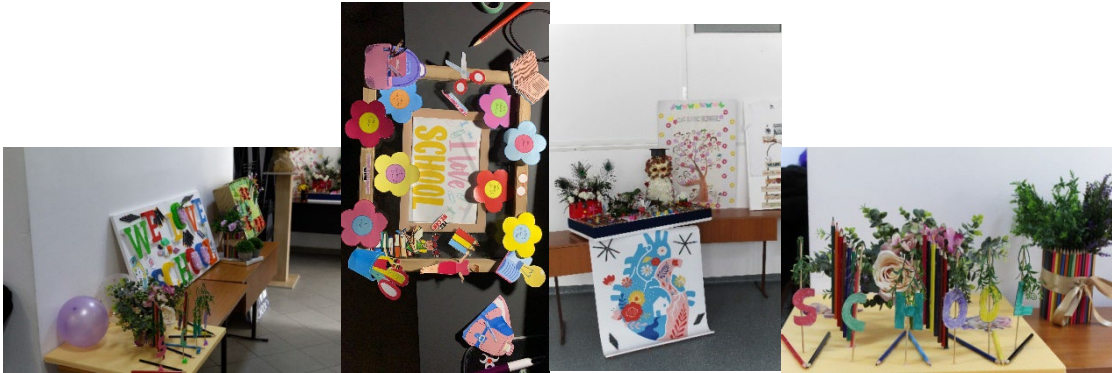
Figura 2. Decorațiuni și aranjamente estetice realizate în cadrul proiectului “Arta fotografică în domeniul științelor”

Cea de-a doua etapă a constat în folosirea unor flori, plante și obiecte decorative, pentru a aranja estetic un spațiu al școlii, aranjament care să conțină mesajul: “We love school!”, realizând fotografii atât în timpul efectuării lucrărilor, cât și cu produsul final (Fig. 2), care au fost încărcate pe platformă, în galeria personală.