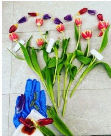
Figura 8. Lucrarea participantă în cadrul proiectului “Arta fotografică în domeniul științelor”, aparținând Andreei

Așadar, două eleve, aflate în clase diferite și lucrând independent una de alta, au realizat două metafore cu o simbolistică similară.