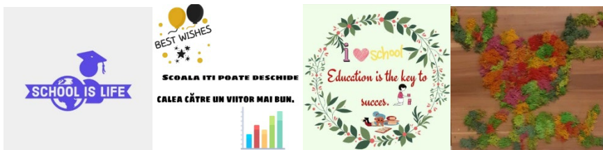
Figura 1. Logouri realizate în cadrul proiectului “Arta fotografică în domeniul științelor”

Prima etapă a proiectului a constat în crearea manuală sau cu ajutorul a diverse programe electronice a unor logouri sugestive, din care să reiasă ideea principală a proiectului. Logourile (Fig. 1) au fost încărcate în fișierele create pe platformă.