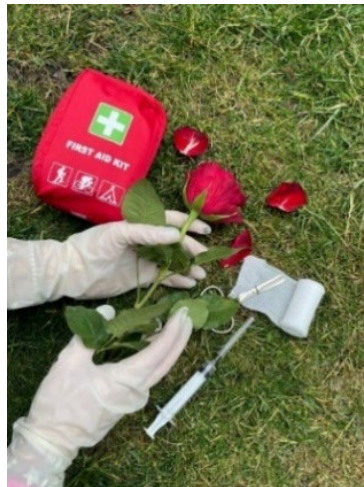
Figura 7. Lucrarea participantă în cadrul proiectului “Arta fotografică în domeniul științelor”, aparținând Ioanei

Fotografia Ioanei (Fig. 7) “s-a dorit a fi o metaforă florală: un trandafir rănit, ridicat cu grijă de niște mâini blânde, pentru a fi tratat și vindecat. În lumea noastră, se traduce prin omul suferind, imobilizat, care este îngrijit cu atenție și devotament de mâinile pricepute ale asistentului medical”.