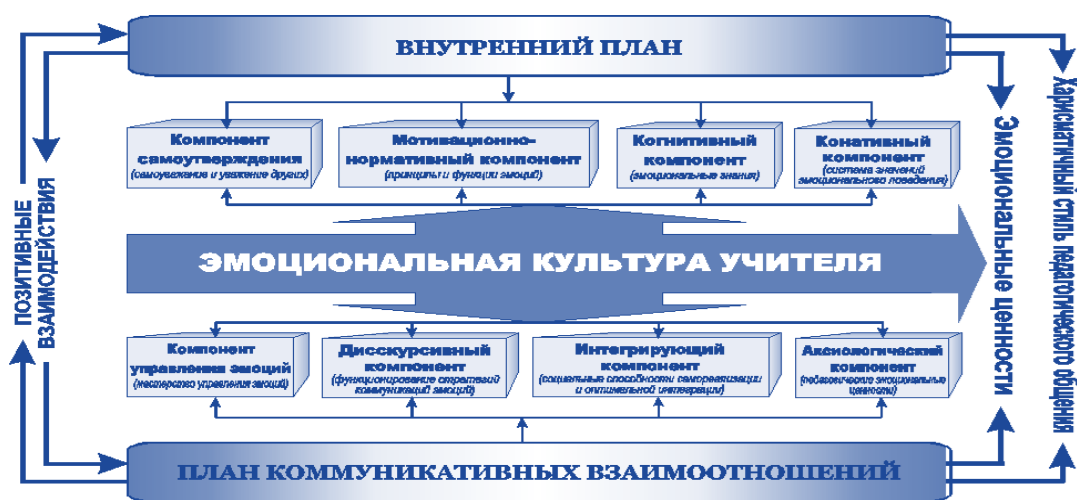
Схема 1. Структура эмоциональной культуры учителя

Для понимания студентами теоретических основ педагогики эмоционального воспитания мы использовали таблицу, характеризующую структуру эмоциональной культуры учителя, которую предложила Борозан М. [4].