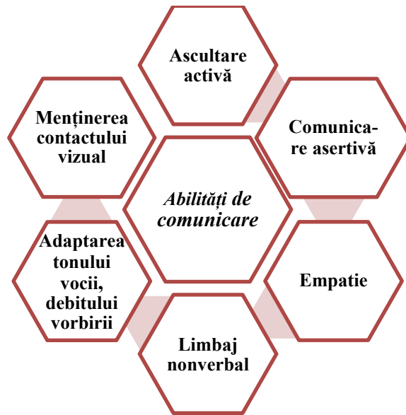
Figura 1. Spectrul abilităților de comunicare ale persoanei

Abilitățile bune de comunicare, de multe ori sunt un panaceu, pentru succesul personal și profesional al persoanei. De aceea, formării și dezvoltării acestora li se atribuie un rol important în actul educațional.