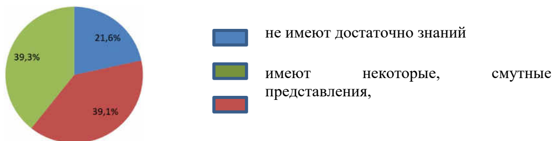
Диаграмма 1. Знания педагогов о психофизических особенностях школьников с ОВЗ

Итак, отвечая на вопрос «Имеют ли педагоги достаточные знания о психофизических особенностях детей с ОВЗ», 21.6% педагогов ответили отрицательно, 39.1% педагогов констатировали, что имеют некоторые, смутные представления, а 39.3% исследуемых ответили, что на их взгляд они имеют достаточные знания об особенностях школьников с ОВЗ.