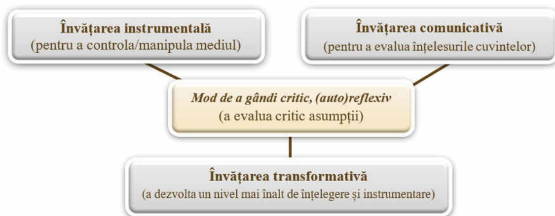
Figura 1. Procesul învățării transformative [3, p.184]

Învățarea transformativă se bazează pe crearea condițiilor care provoacă „momente Evrica” în care subiecții identifică, brusc și neașteptat, o problemă dintr-o nouă perspectivă și descoperă soluții care au fost sau nu, luate în calcul de opiniile sau credințele susținute anterior. Un rol foarte primordial în facilitarea învățării transformative o au cadrele didactice care trebuie să-i captiveze pe formabili cu informații nedescoperite încă de ei, să le prezinte și alte alternative sau căi de rezolvare a situațiilor problemă pentru a-i face curioși să descopere necunoscutul despre ceea ce urmează să fie predat. Deseori, formabilii se confruntă cu dileme dezorientante sau se află în situația când nu recunosc prezența lacunelor în achizițiile deținute sau faptul că comprehensiunea lor actuală este incompletă/eronată, de aceea este semnificativ ca formatorii să intervină în acest sens și să îi orienteze corect, să le prezinte argumente și soluții noi pentru a înlesni procesul de învățare transformativă.