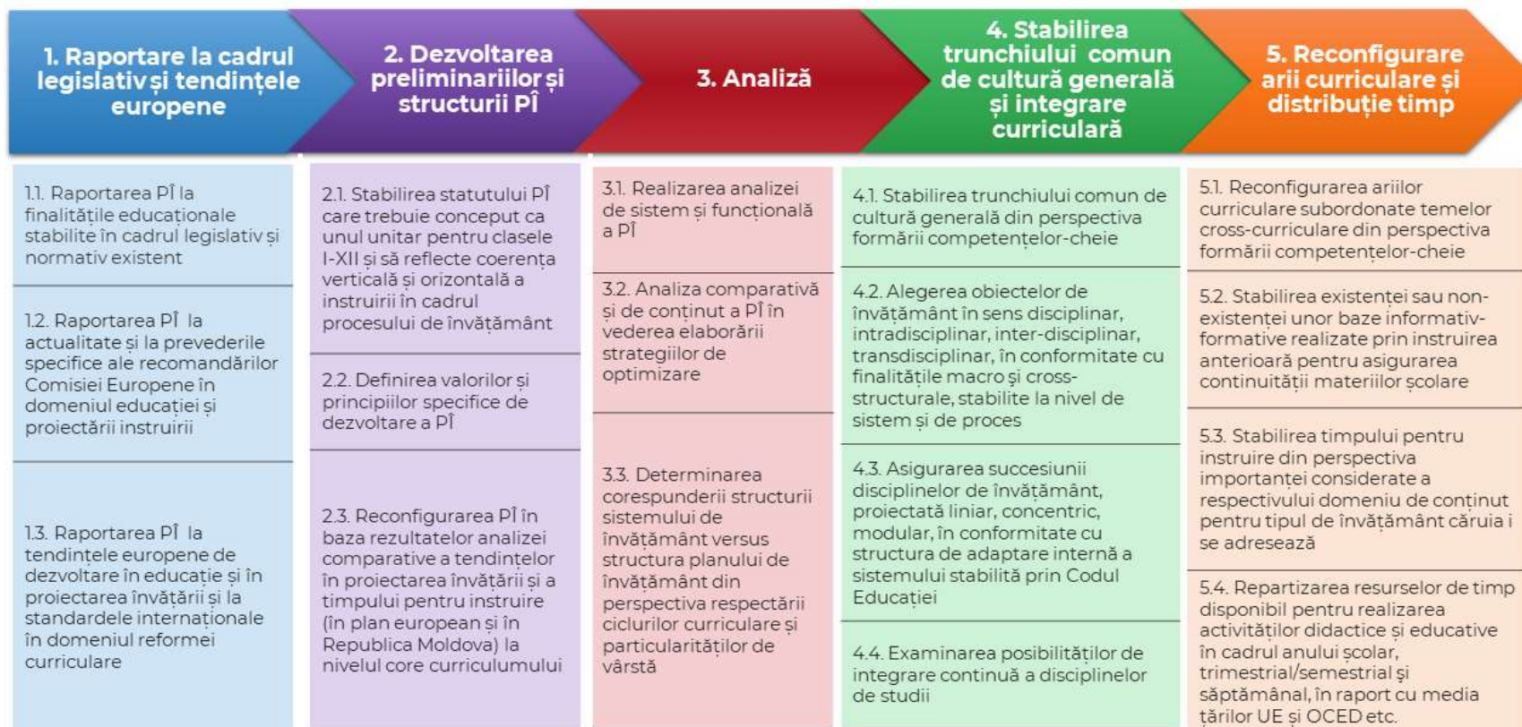
Figura 2. Algoritm de lucru în dezvoltarea unui nou PÎ