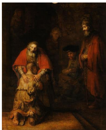
Figura 2. „Întoarcerea fiului risipit” Rembrandt van Rijn