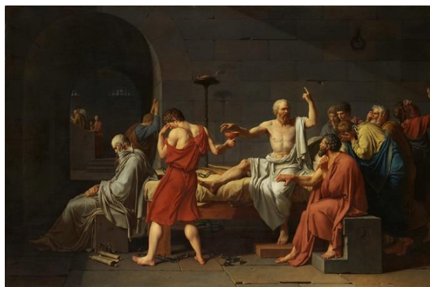
Figura 3. „Moartea lui Socrate”, J.Louis David

O amplificare considerabilă a valorilor etice este vădită în perioada neoclasicistă sau perioada revoluțiilor franceze, când „renasc” principiile artei clasiciste, cu referință la cea din perioada Romei Republicane. Principalul reprezentant al acestui curent Jaques Louis David considera, ca și pictorul J-B. Greuze, că arta prezintă o armă puternică în educarea contemporanilor. David nu se limita doar la reprezentarea subiectului cu putere sugestivă, ci încearcă să explice teoretic aceste norme morale, care, credea el, vor putea modifica mentalitatea societății. Accentul principal al normelor propagate de către el oscilau spre valorile politice, artistul chemând direct și indirect spre autoperfecționare, cunoaștere de sine, demnitate, dragoste față de țară (care trebuie să prevaleze asupra dragostei față de aproapele său) etc. ( Jurământul fraților Horațiu , Moartea lui Socrate (Fig. 4), Brutus ș.a.).