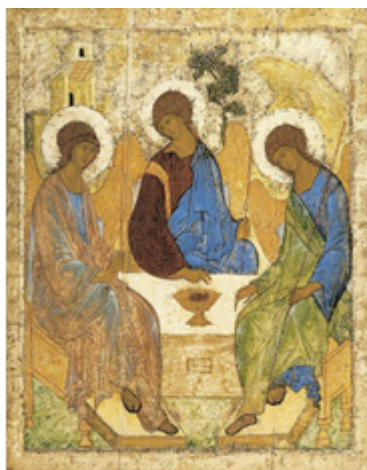
Figura 1. „Troița”, A. Rubleov

În perioada medievală, când se modifică conceptul despre lume a societății, care devine unul predominant religios, valorile etico-morale devin primordiale și obțin un caracter „didactic”. În perioada bizantină, accentul principal nu mai revine autoaprecierii, independenței, tendinței către glorie etc., întâlnite în epoca antică, ci dragostei materne și dragostei față de Dumnezeu, generozității, sincerității, compătimirii, stoicismului etc. Chipul Fecioarelor și al Sfinților de pe icoanele medievale trezesc și astăzi și astăzi în sufletul spectatorului cele mai profunde sentimente de bunătate, dragoste, datorie și îndeamnă către un comportament adecvat, spre fapte mai bune. Privirea captivantă a acestor personaje au capacitatea de a detașa spectatorul de lumea reală, plasându-l într-un spațiu sacru, spiritual, unde lipsesc cu desăvârșire aspectele negative ale valorilor morale. ( Troița , sec. XV, A. Rubleov (Fig.1); Maica Domnului din Vladimir , sec. XII, ș.a.).