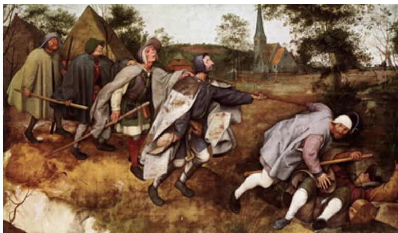
Figura 2. „Parabola orbilor”, P. Bruegel cel Bătrân

În arta vest-europeană (stilul romanic și gotic) aceste calități sunt intercalate și „dilate” cu imagini din folclorul plastic al popoarelor europene. Viziunea cosmogonică asupra lumii, tradițiile locale penetrează nucleul religios și îi modifică aspectul. În arta romanică și gotică conceptul etico-moral obține noi forme plastice. În arhitectură, ca principal „centru” religios, este concentrată ideea primordială a religiei creștine, învingerea Binelui asupra Răului, prevalarea eticului asupra manifestărilor bestiale ale sufletului. Sub aspect plastic, acest raport este reprezentat prin imagini monstruoase ale Garguilor de pe fațada edificiului, cărora li se opune proiecția Luminii Divine din vitraliile geamurilor și a rozetei centrale reflectată pe pereții interiori ai bisericii și imaginea sfinților sau a îngerilor. Acest raport constituie opoziția spiritualului concentrat în spațiul interior și a fizicului, materialului de pe suprafața exterioară a lăcașului. Lumea divină din interior (ideea proiecției divinului în uman) și lumea fizică supusă ispitelor „trupești” se află în această perioadă într-o strânsă corelație.