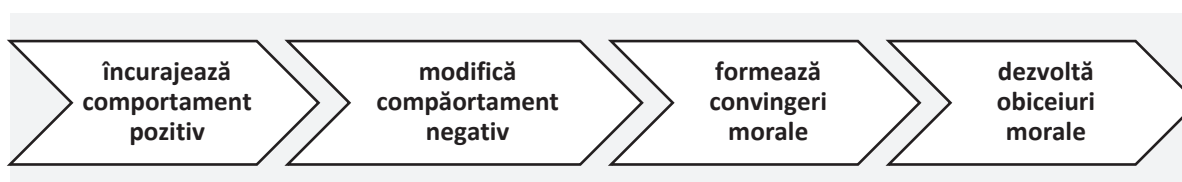
Fig. 3. Avantajele recompensei

Pe de altă parte, recompensele au mai multe avantaje, cu condiția să fie aplicate rațional, să fie explicate copiilor. În figura 3 reiterăm avantajele recompenselor.