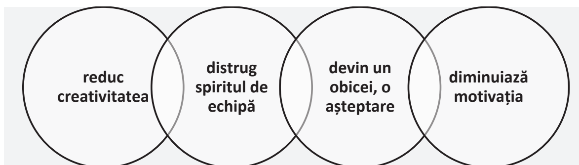
Fig. 2. Limitele recompenselor

Pe de altă parte, recompensele au mai multe avantaje, cu condiția să fie aplicate rațional, să fie explicate copiilor. În figura 3 reiterăm avantajele recompenselor.