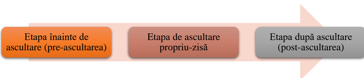
Figura 2. Etapele ascultării

O lecție dedicată dezvoltării abilităților de ascultare trebuie să cuprindă trei etape: pre-ascultarea , ascultarea propriu-zisă , post-ascultarea (Figura 2).