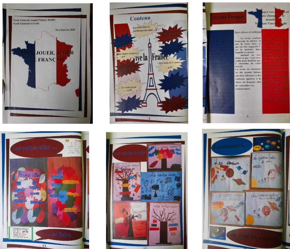
Figura 2. Revista „Lire, jouer, aimer le français” (selectii)

În prezent cercul de limba franceză se realizează online pentru clasele a VI-a și a VII-a, și în format fizic pentru clasa a V-a, proiectele elevilor fiind postate pe pagina de Facebook a școlii. Proiecte sunt realizate fie prin diferite tehnici (desen, pictură, grafică, colaj pentru clasa a V-a), fie sunt realizate cu ajutorul unor jocuri și aplicații precum: Minecraft, Canva, Capcut, Instagram, Stoyjumper, Picsart etc. (Figura 3).