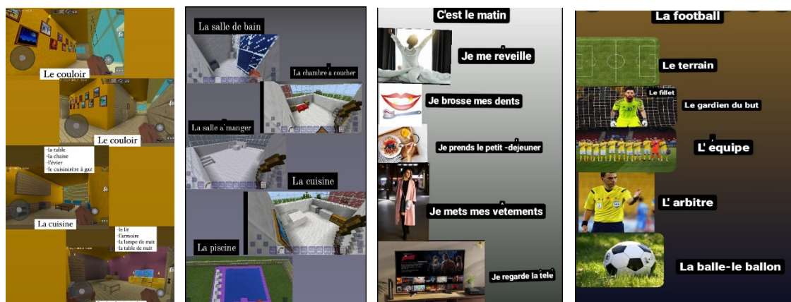
Figura 3. Imagini de la cercul de limba franceză desfășurat în regim online

În prezent cercul de limba franceză se realizează online pentru clasele a VI-a și a VII-a, și în format fizic pentru clasa a V-a, proiectele elevilor fiind postate pe pagina de Facebook a școlii. Proiecte sunt realizate fie prin diferite tehnici (desen, pictură, grafică, colaj pentru clasa a V-a), fie sunt realizate cu ajutorul unor jocuri și aplicații precum: Minecraft, Canva, Capcut, Instagram, Stoyjumper, Picsart etc. (Figura 3).