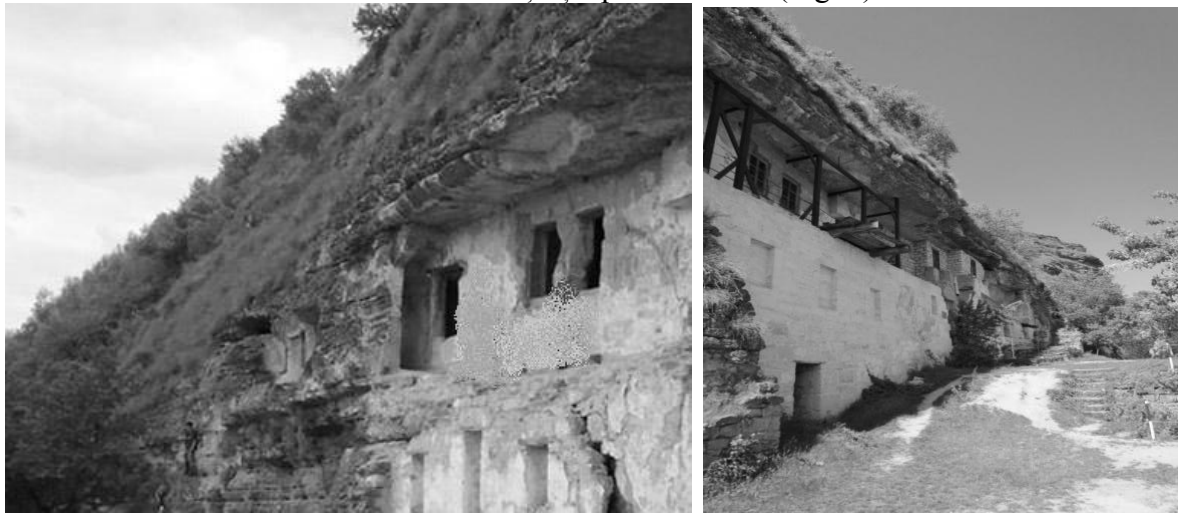
Fig. 3. Mănăstirea rupestru Țîpova, A – până la restaurare; B – construcții actuale

În anul 1975 mănăstirea Țîpova a fost luată sub ocrotirea statului, fiind supusă lucrărilor de restaurare, pentru a se crea aici un impresionant muzeu sub cerul liber. Sălile spațioase, din stâncă, fiind transformate în expoziții de obiecte de antichitate găsite în împrejurimile satelor Țîpova, Horodiște, Lalova, Saharna. Braniștea e unică prin diversitatea bogăției arheologice: sate și orașele străvechi, cetăți, biserici, schituri și cimitire sunt săpate în versantul abrupt. Această perlă a patrimoniului național este inclusă în cele mai prestigioase cataloage și prospecte turistice din Europa. Însă, în ultima perioadă mănăstirea Țîpova a intrat în transformări majore, care afectează grav identitatea rupestră. Vechile „grote“ săpate de creștini în calcar sunt acum transformate în adevărate camere, realizate cu ciment, beton și metal. Construcțiile actuale au modificat aspectul de altă dată al mănăstirii în detrimentul identității și specificului ei (Fig. 3).