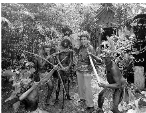
Imagine 1: Printre aborigenii din insula Efate, Vanuatu, 2018