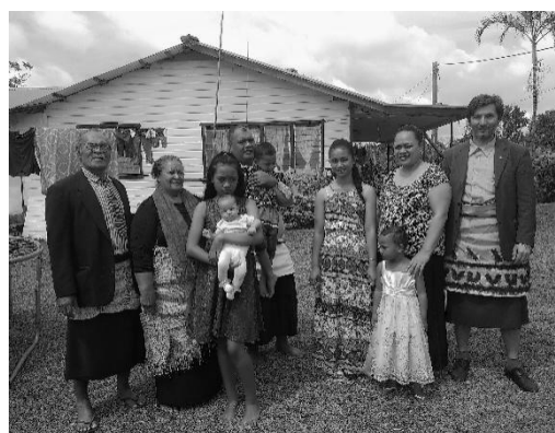
Imagine 2: Printre polinezienii din insula Eua, Regatul Tonga, 2018