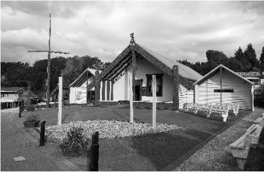
Imagine 5: Marai maori în Whakarewarewa, NZ