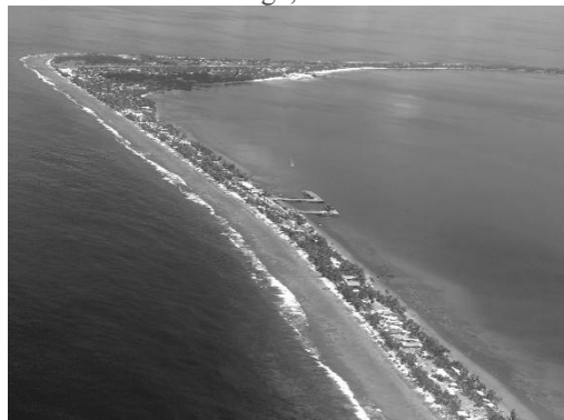
Imagine 4: Insula Funafuti, Tuvalu, 2018