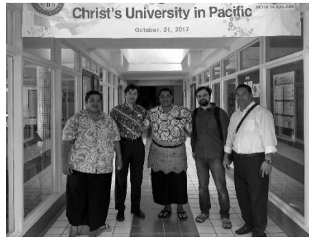
Imagine 6: Universitatea din Tonga