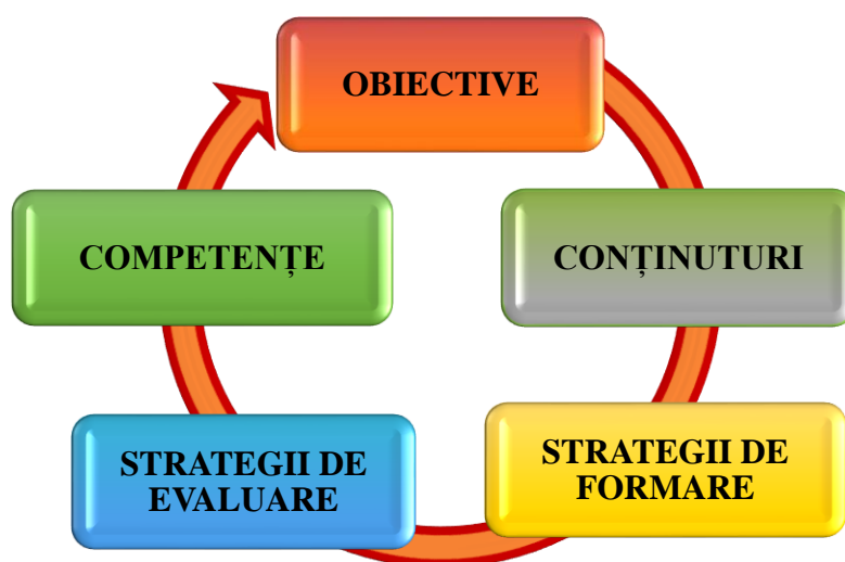
Figura 2. Componentele curriculumului

După cum menționează M. Hadîrcă, noua abordare vizează o schimbare de optică nu doar în ceea ce privește conceperea, proiectarea și realizarea educației, ci și în ceea ce privește organizarea procesului educațional și managementul școlii. Ea solicită, în primul rând, o re-evaluare a politicii statului, precum și a atitudinii societății în general, vizavi de copiii cu cerințe educaționale speciale, excluși și/sau marginalizați anterior în vederea schimbării acesteia pe o atitudine mai tolerantă și a recunoașterii diversității umane, astfel încât statul să asigure la locul de trai condiții egale de învățare fiecărui elev. În al doilea rând, educația incluzivă impune o nouă abordare a scopurilor, obiectivelor și formelor de organizare a educației. Astfel, scopul școlii generale este de a asigura accesul tuturor copiilor la educația de bază, de a contribui la reducerea izolării și a segregării în învățământ, acesta fiind și răspunsul posibil la provocările unei pedagogii respondente , ce vizează acțiunea de normalizare a vieții copiilor , prin incluziune, cooperare și conlucrare, coparticipare și interacțiune școlară și socială [10].