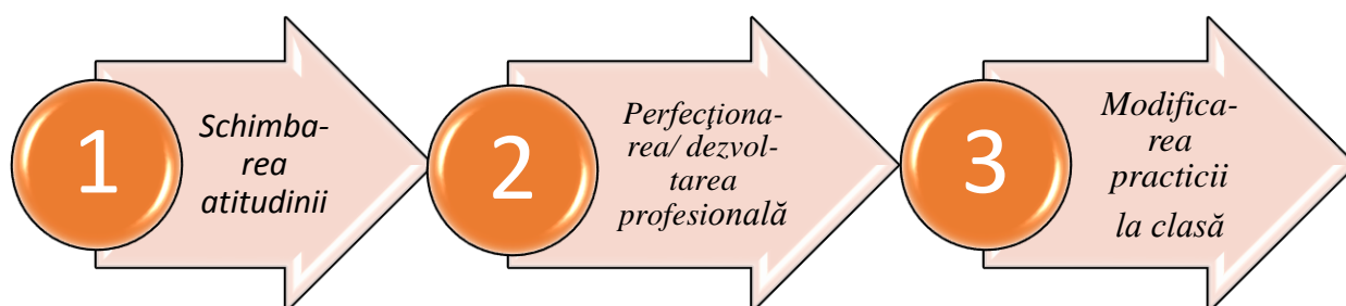
Figura 3. Direcțiile principale de formare pentru cadrele didactice din școlile integratoare

În opinia cercetătorului T. Vrasmaș, cadrele didactice din școlile integratoare vor ține cont de trei direcții principale [7]: