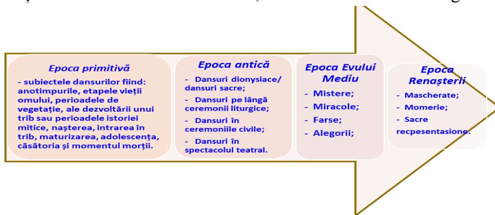
Figura 1.1. Axa cronologică a evoluției artei dansului

Dansul, alături de muzică și sport, reprezintă astăzi unul dintre elementele culturii tradiționale, indicând atașamentul pe care românii basarabeni îl au față de propria lor tradiție culturală. Fiind o totalitate de mișcări plastice, de gesturi și de pași, care se execută succesiv în ritmul unei muzici anumite, exteriorizându-i conținutul emoțional, dansul poate fi o manifestare artistică (dansul popular; profesionist) sau o formă de distracție în societate, precum este considerat dansul de salon. Evoluția artei dansului reprezintă un îndelungat proces istoric-cultural, de la dansurile vechi ale omului primitiv, care erau niște imitații ale mișcărilor caracteristice unor procese de muncă, până la formele complexe ale artei coregrafice contemporane. Dansul a atins o înaltă perfecțiune artistică încă în antichitate, ceea ce este reflectat în Figura 1.1.