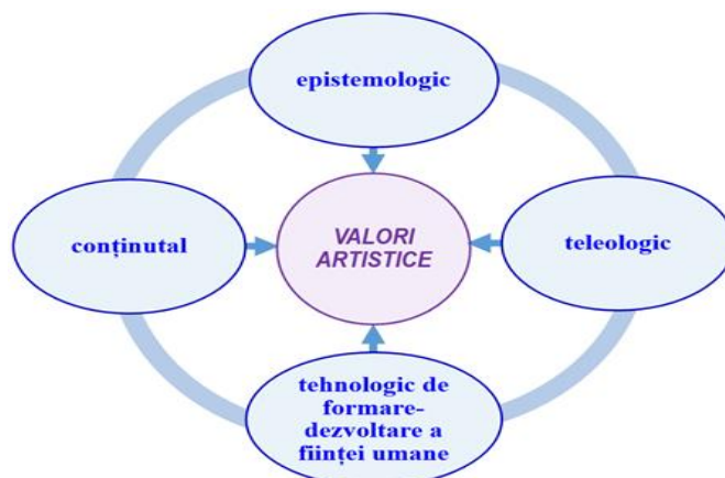
Figura 2.1. Influențele în formarea valorilor artistice la studenții-profesori de dans

capacităților creative și metodologice de creare a unei opere artistice specifice unei arte.