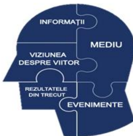
Figura 2. Apariția convingerilor la personalitatea în devenire, după R. Dilts [11]

Odată formate, convingerile determină modul în care interpretăm informațiile, felul în care gândim, simțim și ne comportăm. Orice convingere începe ca un simplu gând ce apare în urma unei situații, a unui eveniment care a fost transmis de către părinți sau societate. Gândul este repetat de atâtea ori până când este acceptat ca fiind un adevăr absolut care nu mai trebuie verificat.