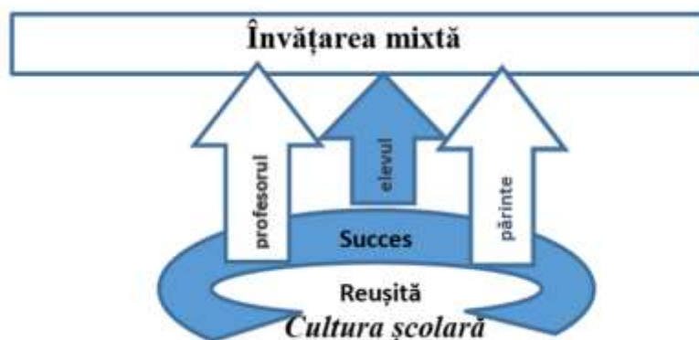
Figura 2. Cultura școlară în contextul învățării mixte

Un element esențial în implementarea cu succes a învățării mixte este cultura școlară. „Cultura este un mod de a lucra împreună pentru atingerea obiectivelor comune care au fost exersate atât de frecvent și cu atât de mult succes, încât oamenii nici măcar nu se gândesc încercând să fac lucrurile într-un alt fel. Dacă s-a format o cultură, oamenii vor face autonom ceea ce trebuie să facă pentru a avea succes” M. Horn.