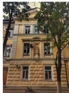
Palatul Justiției/Sediul Tribunalului Regional (1887)