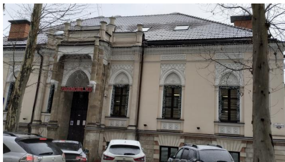
Casă de raport (1901) de pe str. Armenească, 96