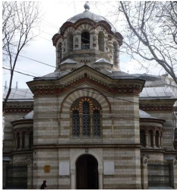
Biserica Sf. Pantelimon (1887-1891)