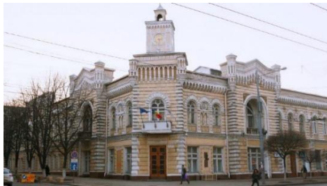
Clădirea Dumei Orășenești (1901-1903)