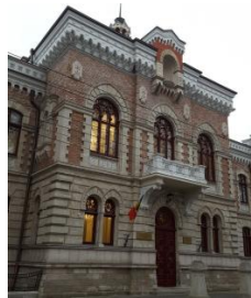
Liceul de fete „Principesa Natalia Dadiani” (1899-1900)