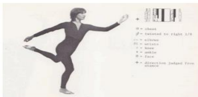
Figure 4. Pose with Labanotation beside (1982). Tracking, Tracing, Marking, Pacing . New York, Grieco Printing Company Inc.