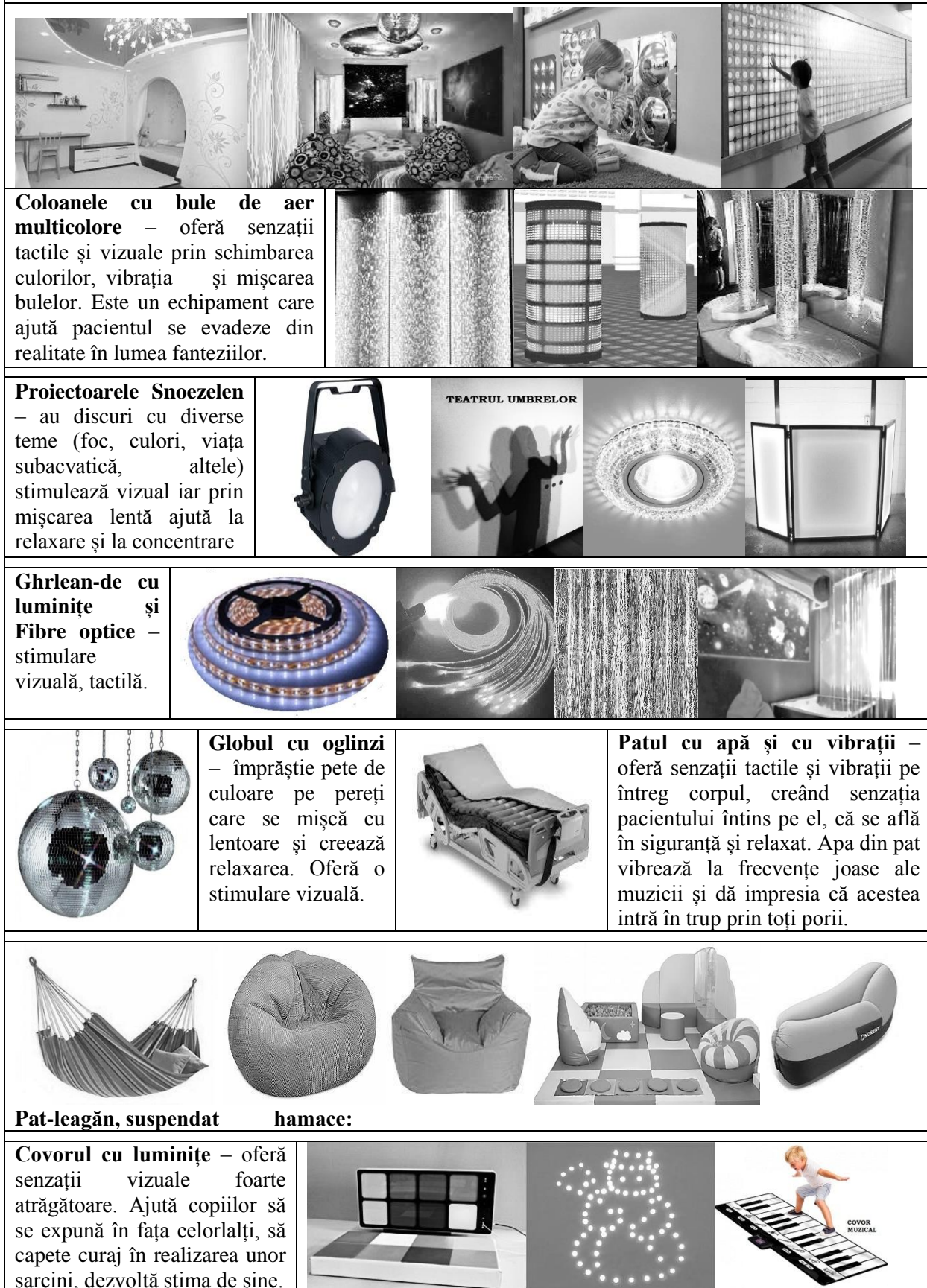
Tabelul 1. Echipamente de amenajarea a camerei Snoezelen. [6]