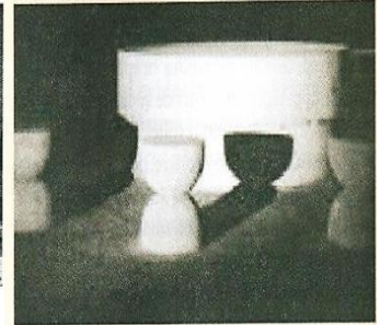
Constantin Brâncuși „Masa tăcerii”

În instituțiile de învățământ din Republica Moldova, la momentul actual, la clasele a XII-a, sunt utilizate manuale alternative pentru predarea temelor la istorie. De cele mai multe ori se apelează la manualul pentru clasa a XII-a, Istoria Românilor. Epoca contemporană , autori Ioan Scurtu, Ion Șișcanu, Marian Curculescu, Constantin Dinca și Aurel Constantin Soare, Editura Prut Internațional, care are trei perioade de ediție 2002, 2006, 2007. În manualul respectiv, cultura din Basarabia din anii 1918-1940 este abordată în capitolul IV. Cultura și știința românească în perioada interbelică , care se încheie cu o lecție de sinteză la tema Renașterea culturii naționale românești în Basarabia interbelică și un test de