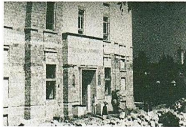
Postul de radio Basarabia, 1939-1941

În perioada postbelică, radioul resimte tot mai puternic concurența televiziunii, dar își păstrează influența mai ales datorită creșterii numărului de stații radiofonice private ce emit în bandă FM. În prezent, spațiul audiovizualului este controlat de societate, în statele democratice, și de stat, sub regimurile autoritare.