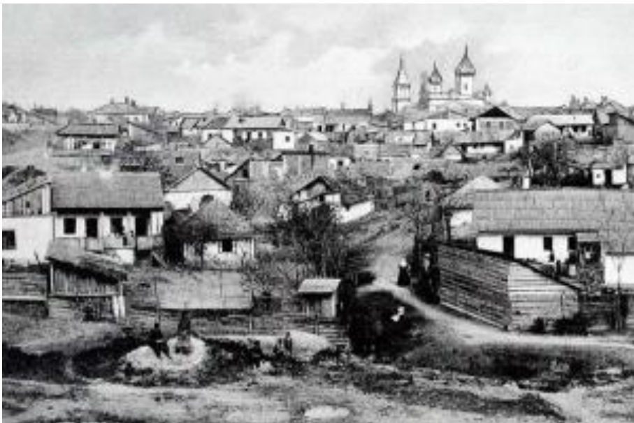
Фото 1. Кишинев начала XX в.