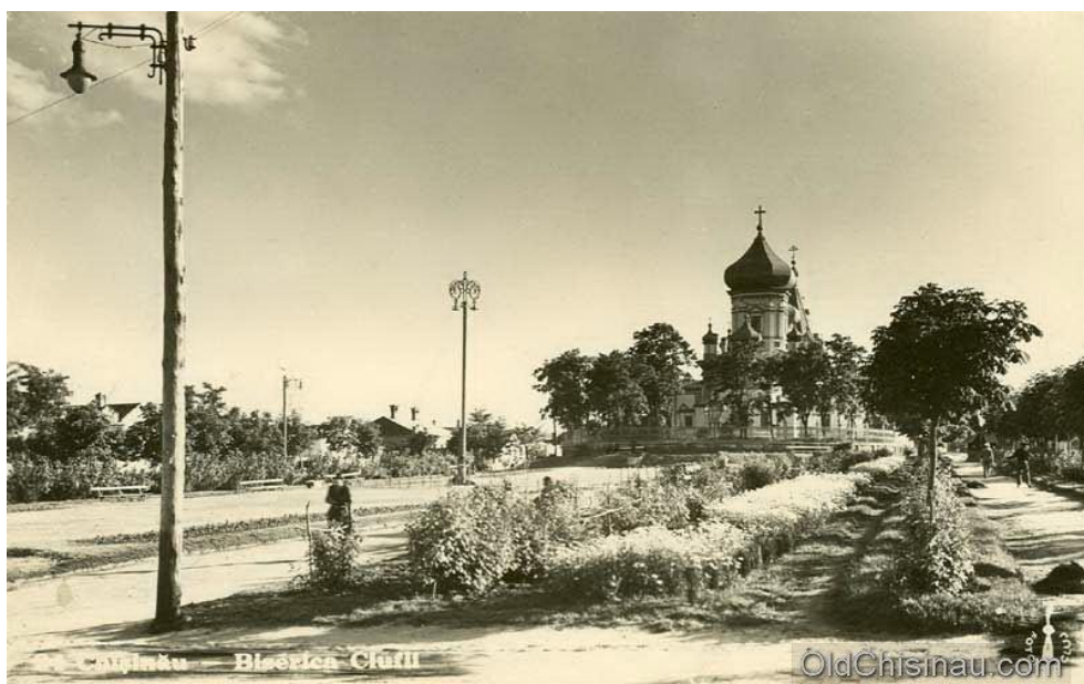
Фото 3. Чуфлинская церковь в начале XX в. Ibidem.