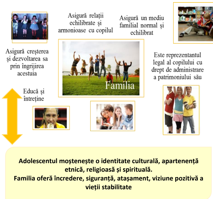
Figura 3. Relațiile de interdependență dintre familie și adolescent