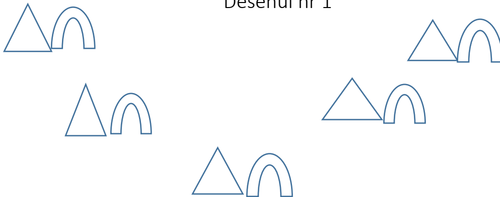
Desenul nr 1

Se începe dansul pe semicerc în perechi băiat și fată cu pasul de la mișcarea nr 1 formând pe deplasare două linii intercalate .