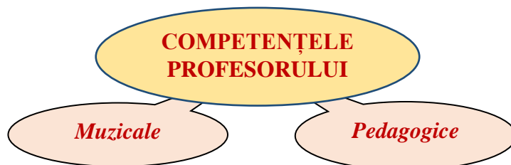
Figura 1. Competențele profesorului de educație muzicală

Profesionalismul specialistului în acest domeniu ține de două aspecte importante, prezentate în Figura 1: competențe muzicale și competențe pedagogice , aflate în strânsă unitate.