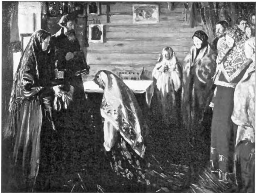
И. С. Куликов. Старинный обряд благословения невесты в городе Муроме. 1909

В условиях родо-племенного общества инициатива могла принадлежать женщине, нормой было самопросватывание девушек. В феодальный период все изменилось. Основная свадебная игра разворачивалась вокруг похищения невесты (её прятали от жениха, преграждали дорогу женихову поезду , разыгрывали сцены доступа жениха во двор, в горницу). Подчеркивалось активное начало со стороны жениха, ритуально обязательным было «нежелание» невесты выходить замуж. В доме невесты пели песни, в которых приезд жениха изображался как ветер, буря , сам же он назывался разорителем и погубителем . Всё это следы брака-умыкания,