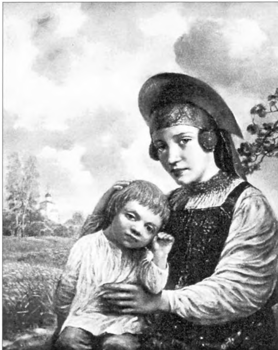
Е. Флёрва. Материнская любовь. 2000

Величальные песни имели поздравительный характер. Ими чествовали, воспевали и прославляли того, кому они были адресованы. Положительные качества человека изображались в высшей степени, часто с помощью гипербол. Большую роль играл портрет. У жениха кудри столь прекрасные,