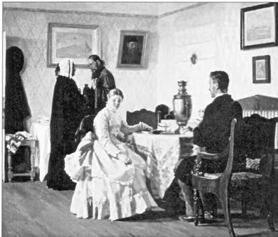
Н.В.Неврев. Смотрини. 1888

Обряды совершались не только в избе, во дворе, в бане, на улице, но и в христианском храме. Они сопровождались возжиганием свечей, молитвами, крестным знаменем, поясными и земными поклонами, церковными песнопениями, окроплением святой водой, каждением ладаном, чтением Евангелия, Апостола и Псалтири — и, наряду с этим, многочисленными и разнообразными магическими действиями, пришедшими из язычества.