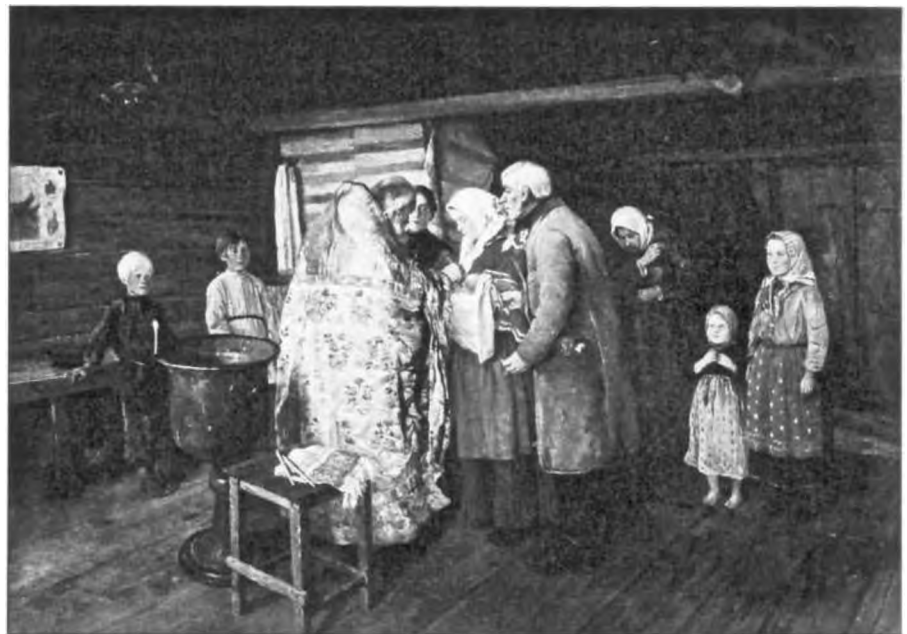
Пётр Коровин. Крестины. 1896

Во время одевания невесты к венцу и ожидания приезда жениха пели лирические песни, выражавшие крайнюю степень её горестных переживаний. При этом могла воз-