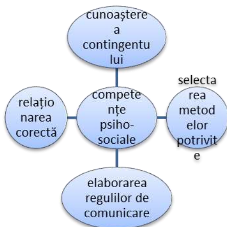
Figura 2. Competențele psihosociale ale educatorului-consilier

Competențele psihosociale contribuie din plin la: