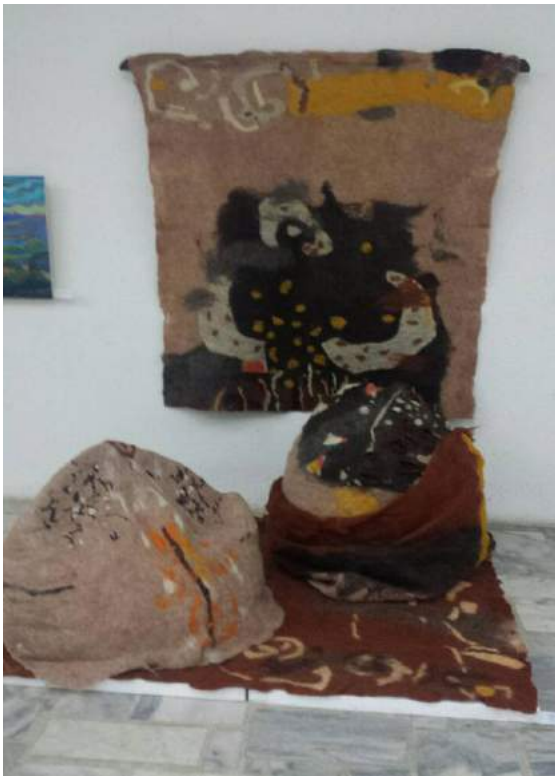
Desenul 5. I. Savițcaia-Baraghin, „Cuib”, pâslă, lână, tehnică clasică, 2015 (România) tehnică mixtă, 2017 (Republica Moldova)

La etapa contemporană, în crearea tapiseriei, se utilizează cu predilecție tehnici mixte, se combină diferite materiale și