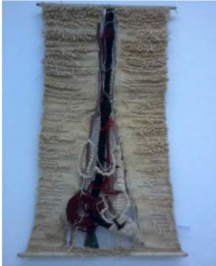
Desenul 4. N. Zimbroianu, „Mlădițe”, tapiserie, sisal,