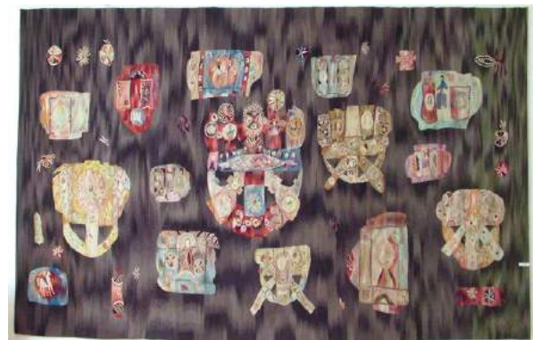
Desenul 2. M. Podeanu, „Tradiții”, tapiserie, 2013, „Oamenii pământului”, tapiserie, 2013 (România) [9]