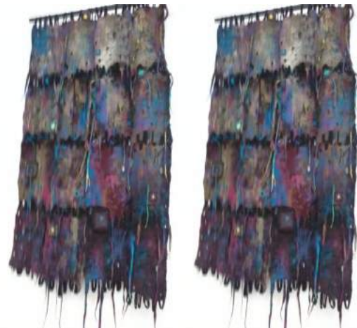
Desenul 6. L. Șevcenco, „Ploaia”, pâslă, 2016,

Noua generație prezintă concepții inedite în realizarea operelor de artă, în special prin coloritul modern contrastant (culorile violet, galben, turcoaz ș.a.), prin soluții moderne de proiectare atât în domeniul tapiseriei artistice, cât și în cel al covoarelor industriale și al designului (Desenele 6, 7.)