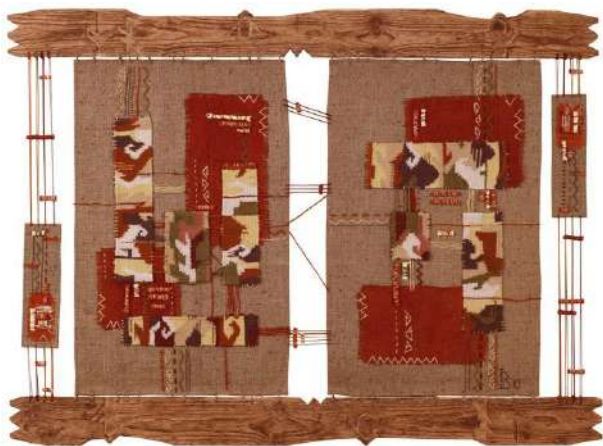
Ил. 14. И. Бурлака, «Архаизм», 2010.

Подобная работа, необычный квадриптих, основанная на колоритах каждого из времен года (зима, весна, лето, осень) и с минимальным композиционным решением, есть и у заслуженного художника РМ Марии Сака-Рэчилэ (одной из основоположников молдавского гобелена), и так же носит название «Времена года» (1980). Структурно-сюжетное наполнение тканой поверхности произведений практически отсутствует, структурные части квадриптиха представляют собой гармоничный фон, точно передающий цикличность и определенный этап смены сезона (Ил. 13).