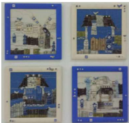
Ил. 20. «Наследие времен», «К. Брынкушь», 2018 (выставка-конкурс «Салоны Молдовы», посвященная национальным праздникам).

Выводы. Подобные критические исследования в области искусства