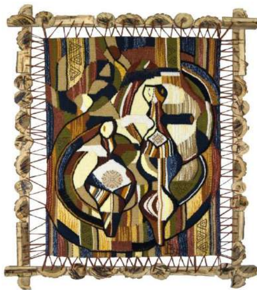
Ил. 15. И. Бурлака, «Кукутениан», 2007.