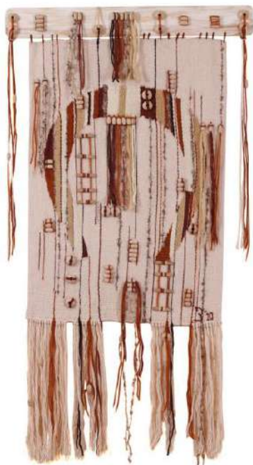
Ил.10. «Фортуна», 2010.

тканья (в дополнении с сизалем и деревом). В подобном ключе отмечены работы талантливого местного художника Андрея Негурэ (например, гобелен «Мэрцишор», 1988 г.) [16], румынского деятеля искусства Николае Зымброяну (Ил. 9).