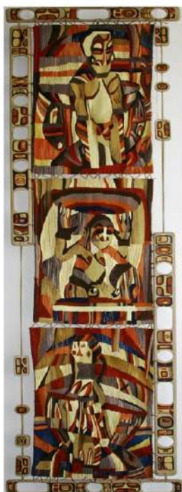
Ил. 18 «Юкатаниан», Дипломная работа, гобелен-триптих, 2007 г. [17].