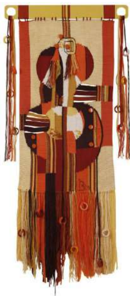
Ил.11. «Осенняя симфония», 2009.