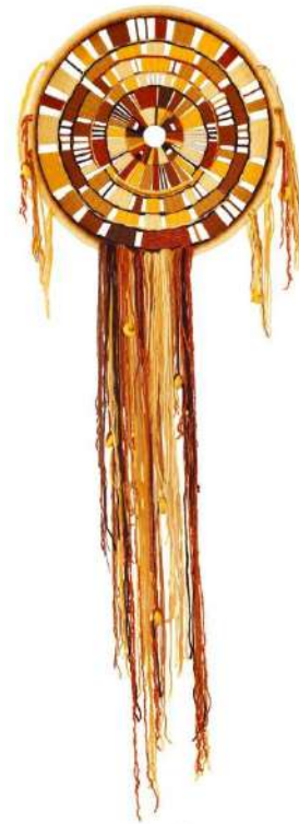
Ил. 5. «Подсолнух», 2009 [17].

Обычно в метафорическом истолковании сказочная птица Феникс – яркий символ вечного обновления, возрождения и бессмертия [19].