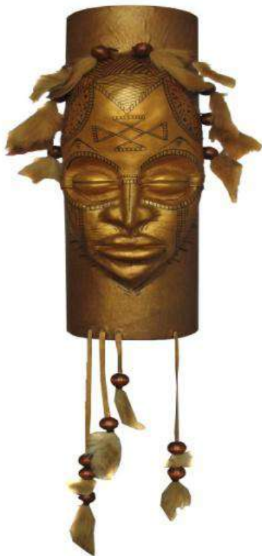
Ил. 17. Африканская маска, 2011.