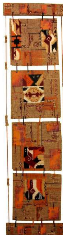
Ил.16. И. Бурлака, «Armenian Impress», 2010.