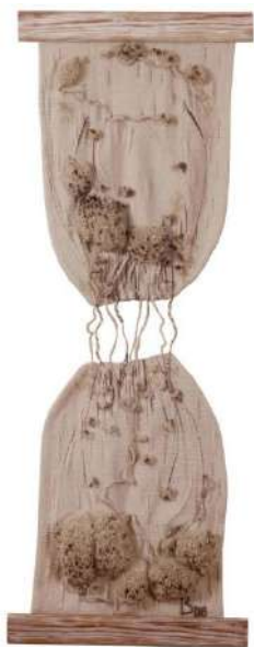
Ил. 8. И. Бурлака, «Клепсидра», 2008, [17].

воплощение, по замечаниям историка (этнолога) Людмилы Моисей, солнца и активности, символ будущего и мудрости [15, с. 193]. В большей или меньшей степени, работа граничит с тождественностью некоторых творений румынского художника Михая Молдовану («Глаза», «Рыба»), изображающего на своих текстильных полотнах в холодной гамме (в морской лазури) тоже очертания правого глаза (Ил. 6, 7). Отметим, данный художественный образ часто встречается и весьма актуален в народном творчестве анонимных мастеров и в профессиональном текстильном искусстве Молдовы. Тканая картина под названием «Земной глаз» была создана и М. Сака-Рэчилэ в 1977 году, с применением хлопка и шерсти [16].