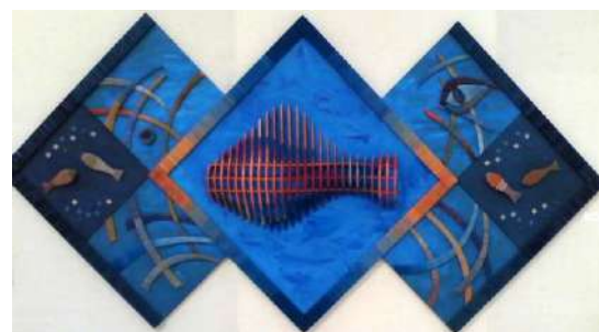
Ил. 7. Работы М. Молдовану, Румыния.

«Земной глаз» – оригинальная текстильная композиция, декоративный объект (Ил. 6) [17]. Глаза – это окно души, зеркало, с которого берут начало любовные чувства. Но также играют роль «наблюдающей камеры» и своеобразного оберега, в окружающем человека пространстве. Земной глаз (правый) – это