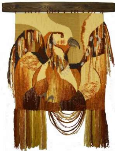
Ил. 4. «Феникс», 2009.

Текстильная работа «Фэникс» (возможно от греч. φοίνιξ «пурпурный, багряный») – метафорико-повествовательный гобелен (Ил. 4) – представляет мифологическую птицу, единственную, уникальную особь своего вида, обладающую способностью сжигать себя и затем возрождаться (как упоминал, о Фениксе, восставшем «словно из пепла», В.Я. Шишков, в историческом романе-саге «Угрюм-река», Книга 2, 1913-1932 гг.). Птица издавна известна в мифологиях разных культур и часто связывается с солнечным культом. Считалось, что феникс имеет внешний вид схожий с орлом в ярко-красном или золотисто-красном оперении. Миф рассказывает, что предвидя свою смерть, он сжигает себя в собственном гнезде, а из пепла снова должен появиться птенец (по другим версиям мифа, из пепла возрождается сам Феникс).