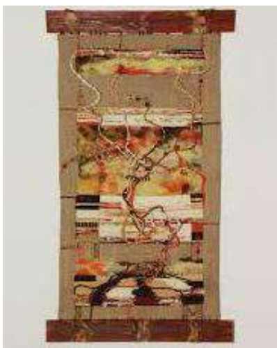
Ил. 19. «Древо жизни», 2012.