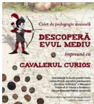
Figura 2. DESCOPERĂ EVUL MEDIU împreună cu CAVALERUL CURIOS, https://www.nationalmuseum.md/ro/news/archive/descopera_evul_mediu_impreuna_cu_cavalerul_curios/

muzeală Altfel de școală la muzeu . Acest instrument de pedagogie muzeală este pus la dispoziția elevilor din ciclul gimnazial în cadrul vizitelor tematice interactive în compartimentul Istorie Medievală al expoziției permanente „Istorie și civilizație” a Muzeului Național de Istorie a Moldovei.