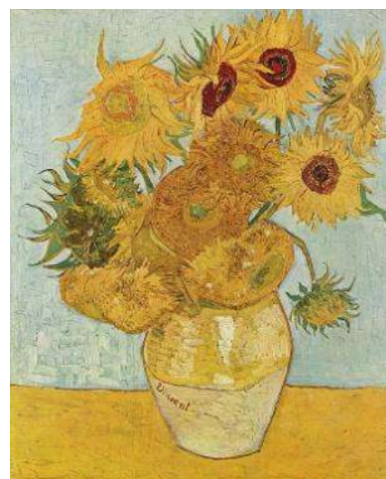
Natură moartă cu floarea soarelui, 1888

O natură statică creativă exprimă atitudinea autorului față de viață, trecută prin propria filosofie și propriul punct de vedere, măiestria profesională. Scopul final este de a transmite privitorului frumusețea celor mai simple obiecte uzuale. Astfel sunt și naturile statice ale lui Van Gogh, pentru care obiectele „banale” servesc drept imbold și sursă pentru a se exprima și a experimenta (naturile statice cu obiecte personale, cu flori (iriși, floarea-soarelui, trandafiri albi), cu obiecte de uz personal