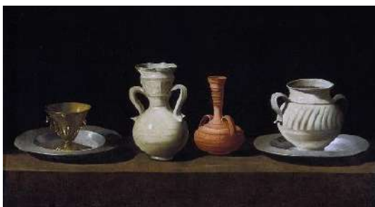
F. Zurbaran, Bodegon, Recipiente

La polul opus, se plasează naturile statice din pictura spaniolă, care au un aspect mai auster, atât sub aspect compozițional, cât și cromatic (fundal întunecat). Obiectele sunt detașate unele de altele și sunt plasate pe o axă orizontală,