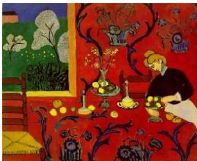
Camera roșie, H. Matisse ș.a.).