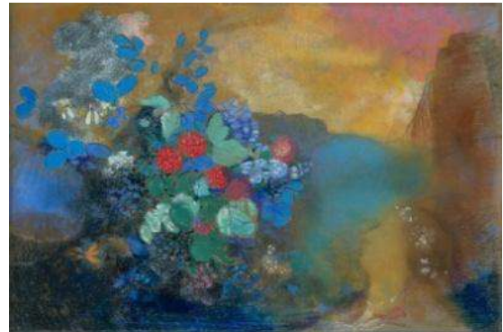
Ophelia, O. Redon

O natură statică creativă exprimă atitudinea autorului față de viață, trecută prin propria filosofie și propriul punct de vedere, măiestria profesională. Scopul final este de a transmite privitorului frumusețea celor mai simple obiecte uzuale. Astfel sunt și naturile statice ale lui Van Gogh, pentru care obiectele „banale” servesc drept imbold și sursă pentru a se exprima și a experimenta (naturile statice cu obiecte personale, cu flori (iriși, floarea-soarelui, trandafiri albi), cu obiecte de uz personal