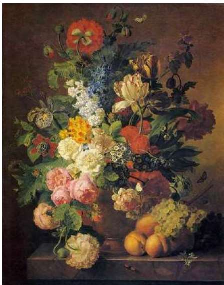
Natură statică cu flori

Preferința pentru buchete pompoase, bogate, „elegante”, complexe (cu flori în diferite stadii – de la boboc până la floare ofilită) se explică atât prin preferința comanditarilor, cât și prin contactul unor artiști cu pictura flamandă (Jan van Huysum, Jan Davidsz de Heem, care în 1636 pleacă în Antwerp (Belgia) ș.a.).