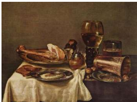
Final de dejun, Willem Claesz Heda

Obiectele reprezentate în acest gen de naturi statice reflectă caracterul, interesele, dorințele, posibilitățile financiare, modul de viață al proprietarului. De exemplu, sticla se asociază cu fragilitatea, ea mai semnifică păcatul și beția, iar vasele din sticlă sparte sunt un simbol al morții;