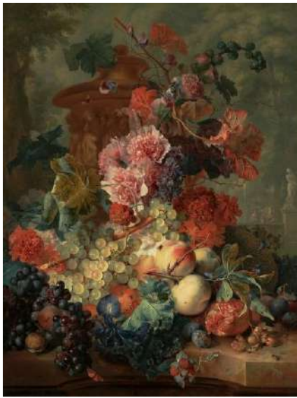
Jan van Huysum, Flori și fructe

tehnică rafinată, imagine „fotografică”, aproape suprarealistă.