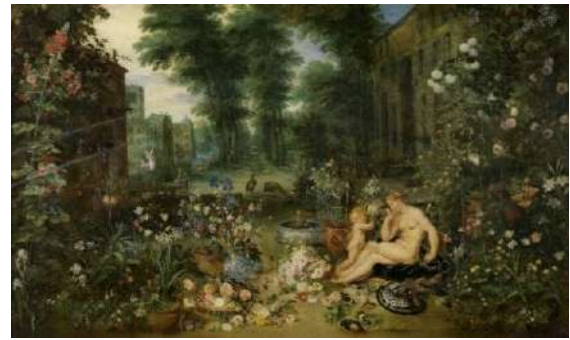
Mirosul , 1618, Jan Brueghel de Catifea

O sinteză a acestor tipuri de natură statică se observă în lucrările cu conținut alegoric (picturi-galerii) și care au drept scop exprimarea celor cinci simțuri, celor patru anotimpuri, a continentelor sau a elementelor esențiale ( Mirosul , 1618, Jan Brueghel de Catifea ș.a.).