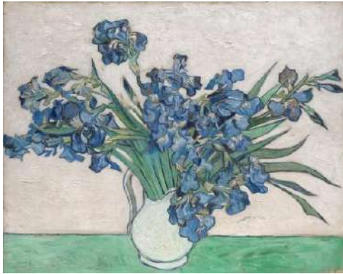
Iriși în vază