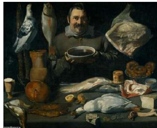
Bodegon-Crâșmarul , D. Velazquez

Primele lucrări de genul acesta constituie o componentă din tablourile numite bodegon și reprezentau scene de bucătărie și cârciumă, în care accentul este pus pe natură statică (obiecte de ceramică, sticlă, ouă prăjite etc.) (D. Velazquez, Crâșmarul, Femeie care prăjește ouă, În tavernă ș.a.).