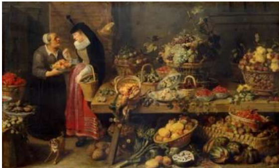
Prăvălia de fructe

imaginii [1, p. 26]. În acest sens, este elocvent ciclul Prăvăliilor – Prăvălia cu vânat, fructe și legume , 1614; Prăvălia de pește , 1618; Prăvălia de fructe, Prăvălia de legume , 1618-1621 ș.a., F. Snyders).