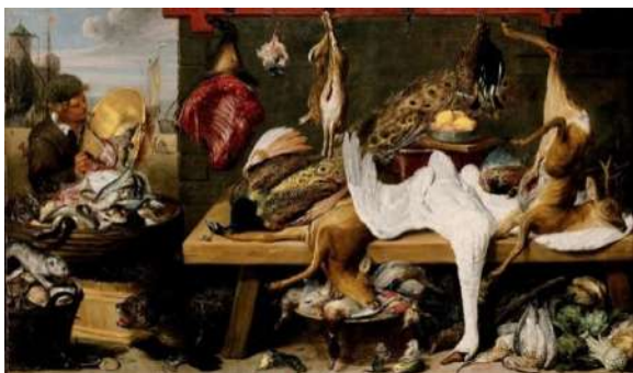
Prăvălia cu vânat și pește