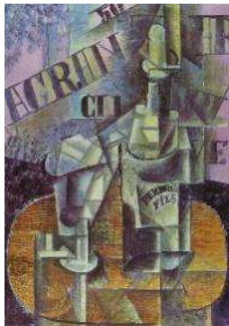
Masă în cafenea, P. Picasso

Cu certitudine, nu toți artiștii plastici tind să realizeze un „tablou-mesaj”, majoritatea mizând pe varietatea expresiei plastice. Unii modelează corpurile prin fațete (J. Gris, G. Braque, P. Picasso), alții le dizolvă în ornamente de arabesc (H. Matisse), le atribuie o „vibrație muzicală” (O. Redon) sau configurații flamboiante, dinamice (V. Van Gogh). Perioada impresionistă este cea mai „liberă” în abordarea subiectului, accentul fiind pus pe vibrația culorii, pe dezvăluirea proprietăților decorative ale obiectelor, pe expresia stării psihologice a artistului, generată în procesul perceperii imaginii plastice (E. Manet, C. Monet, K. Korovin, I. Grabar ș.a.).