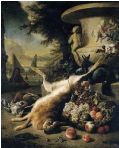
Jan Weenix, Natură statică cu iepure vânat

plante exotice (Willem van Aelst, Jan Weenix).