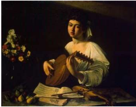
Băiatul cu lăuta