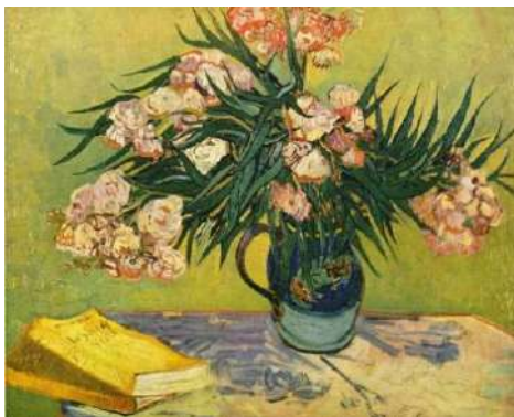
Natură moartă cu flori

În secolul al XX-lea, natura statică devine, pentru pictori, o modalitate de expresie artistică în calea experimentărilor plastice, fiind „transfigurată” în funcție de curentul artistic și „dizolvată” în spațiul larg al ambientului (interior, peisaj etc.), uneori, chiar obținând aspecte bizare (la suprarealiști, pot fi impregnate de conotații simbolice).