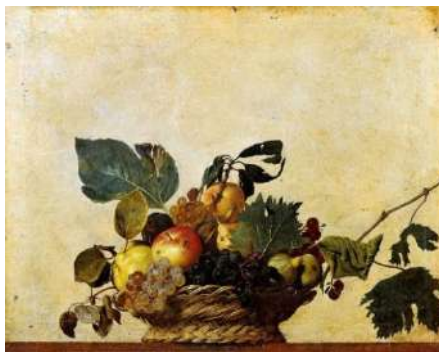
Natură statică cu fructe, 1597

Deși relevă mediul ambiental al omului, obiectele întâlnite în naturile statice din pictura europeană caracterizează ocupația, poziția socială (monede, cântar, instrumente muzicale, instrumente de măsurat etc. (din camera astronomului, geografului etc.)), starea financiară a acestuia, obțin valoare simbolică; natura statică propriu-zisă devenind o criptogramă ce necesită decodificare sau care poartă un anumit mesaj.