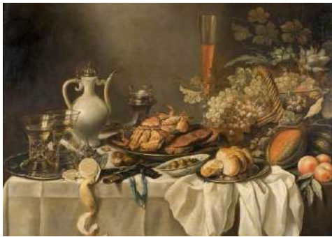
Dejun, 1652, Pieter Claesz

O idee sugestivă se întâlnește și în naturile statice cu „dejunuri” și „final de dejun”, care țin nu atât de reprezentarea diverselor situații ale caracterului mesei (mai bogat, mai modest), cât de prezența indirectă a omului în tablou, el existând în afara cadrului ramei.