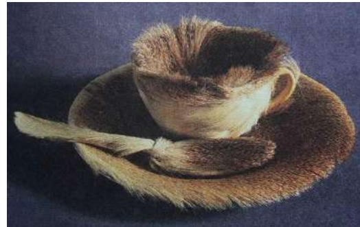
Serviciu de blană, Meret Oppenheim

Rolul naturii statice, indiferent de cerințele și fluctuațiile vremii în care a fost creată, este incontestabil, deoarece ea stă la baza picturii/artei, prin redarea obiectelor din lumea înconjurătoare. În traseul său de formare, pictorul, pentru a se exprima, recurge la imaginea obiectelor neînsuflețite, cercetează și „descoperă” această lume sub aspect tematic, stilistic și tehnologic.