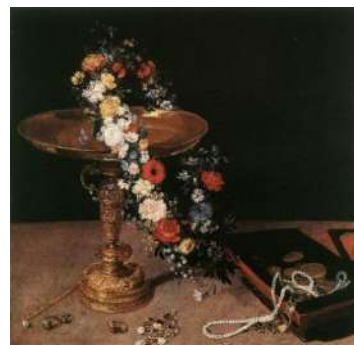
Jan Brueghel de Catifea, Natură statică cu ghirlandă de flori

Spre sfârșitul sec. al XVII-lea, în Olanda apare un nou gen de naturi statice, care reflectă, de fapt, tendința negustorilor îmbogățiți către un mod de viață aristocratic, și anume, de a petrece timpul liber vânând animale (se imită gusturile și obiceiurile nobilemii franceze). În asemenea lucrări se reprezintă trofee de vânătoare în interioare, dar și animale și păsări vii pe fundalul parcului sau grădinii cu fântâni și