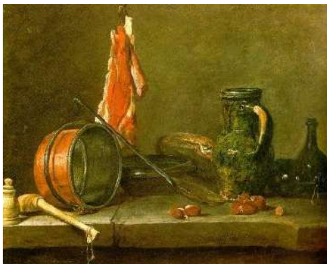
Natură moartă de bucătărie

În sec. XIX-XX accentul se pune pe mijloacele plastice inedite, pictorii se detașează de redarea frontală tradițională și recurg la o optică „panoramică”, de sus în jos a imaginii (viziune împrumutată din stampele japoneze). Această viziune de perspectivă (sferoidală sau „zbor de pasăre”) permite focalizarea egală asupra tuturor obiectelor de pe suprafața mesei, deci și studierea lor mai atentă sub diverse unghiuri. De fapt, pictorul francez P. Cezanne recurge la astfel de compoziții, mai „complexe”, pentru a studia problemele de perspectivă, pe care le evocă atât prin indicii liniare, cât și prin tonuri cromatice, care definesc planurile în profunzimea aeriană (în prim-plan, nuanțe calde și intense, în plan secund – culori reci și deschise). Prin intermediul naturilor statice, artistul ajunge la concluzia că forma oricărui obiect din natură se poate modula din trei corpuri geometrice simple – sferă, con, cilindru –, văzute în perspectivă, fapt ce va sta la baza apariției curentului „cubist” în arta europeană (naturile sale statice au aspect „constructiv”, monumentalizat, obiectele au suprafețe rigide, geometrizzate și simplificate).