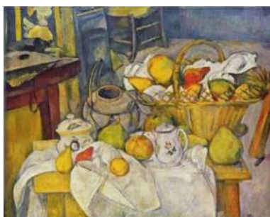
Natură moartă cu coș, 1888-1890