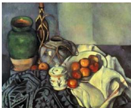
Natură moartă cu draperie gri

Totodată, această reprezentare „sub lupă” sugerează tendința de a reda „panoramic” universul lumii interioare a obiectelor ce ne înconjoară. Uneori, obiectele exprimă un mesaj personal al artistului, detașându-se de funcția lor imitativă și sugerând o idee, de cele mai multe ori „pesimistă” (tristețe, dramatism ș.a.). De exemplu, cartofii negri sugerează legătura dintre țărani și pământ, peștele –