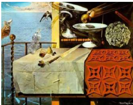
Natură statică, S. Dalí

În secolul al XX-lea, natura statică devine, pentru pictori, o modalitate de expresie artistică în calea experimentărilor plastice, fiind „transfigurată” în funcție de curentul artistic și „dizolvată” în spațiul larg al ambientului (interior, peisaj etc.), uneori, chiar obținând aspecte bizare (la suprarealiști, pot fi impregnate de conotații simbolice).