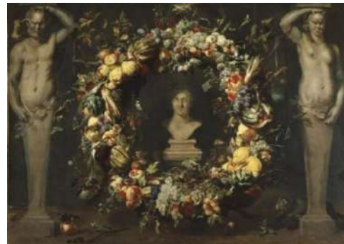
Frans Snyder, Flori cu bustul lui Ceres

În categoria naturilor statice cu flori pot fi incluse și picturi cu ghirlande de fructe sau de flori, ale căror elemente ornamentale sugerau emblematic simbolismul floral și care se plasau, de obicei, pe un cadru de piatră (Jan Philip van Thielen).