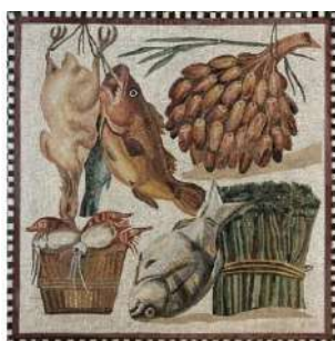
Mozaic din Pompei