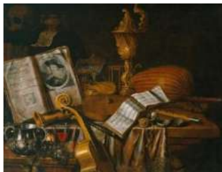
Naturi statice „Vanitas”, Olanda

Sensul mistico-moralizator este prezent și în subiectul Memento mori („ține minte că vei muri” – motiv apărut pentru prima dată la poetul antic latin Horațiu), care reflectă direct tema triumfului morții. În cazul imaginilor cu fructe, acestea erau reprezentate în stare de alterare, iar florile – ofilite. Stridiile erau simbol al desfrâului. Acest gen de naturi statice invită la meditație asupra efemerității vieții, a iminenței morții și-i impune spectatorului o atitudine sobră referitoare la viață [1, p. 27].