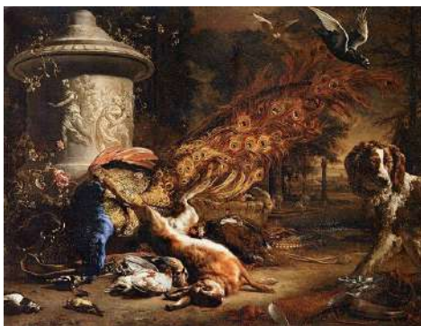
Natură statică cu vânat și câine

O altă formă de natură moartă era cea în care apăreau obiectele caracteristice unei meserii. Astfel de tablouri se expuneau în holul casei și constituiau mândria posesorului.