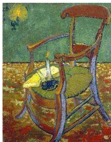
Scaun la lumina lumânării

Continuând această „metamorfoză” a naturii statice, unii artiști dezintegrează obiectele în fragmente și le îmbină în forme originale recognoscibile, creând din detalii imagini noi (cubiștii).