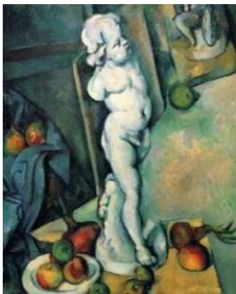
Natură moartă cu amoraș, 1895