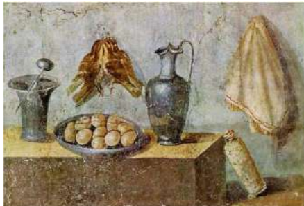
Frescă pompeiană din Casa Julia

Ulterior, în perioada medievală, în pictura preponderent religioasă, se utilizează obiecte cu caracter liturgic și care poartă semnificație spirituală: cupă, pâine, struguri (vin), pește (simbolul lui Hristos), cartea de rugăciuni (Biblia), vas cu flori (trandafirul – simbol al Fecioarei Maria, transcendenței, iubirii; crinul – simbol al Fecioarei Maria, al virginității,