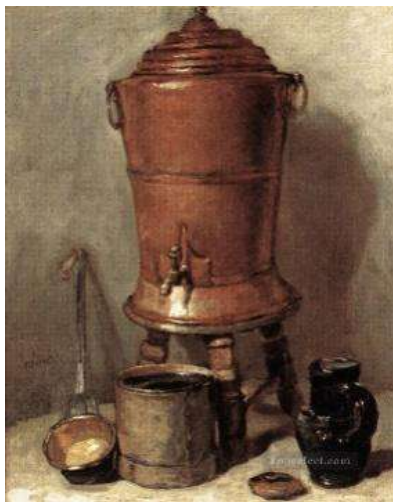
Natură moartă cu cazan