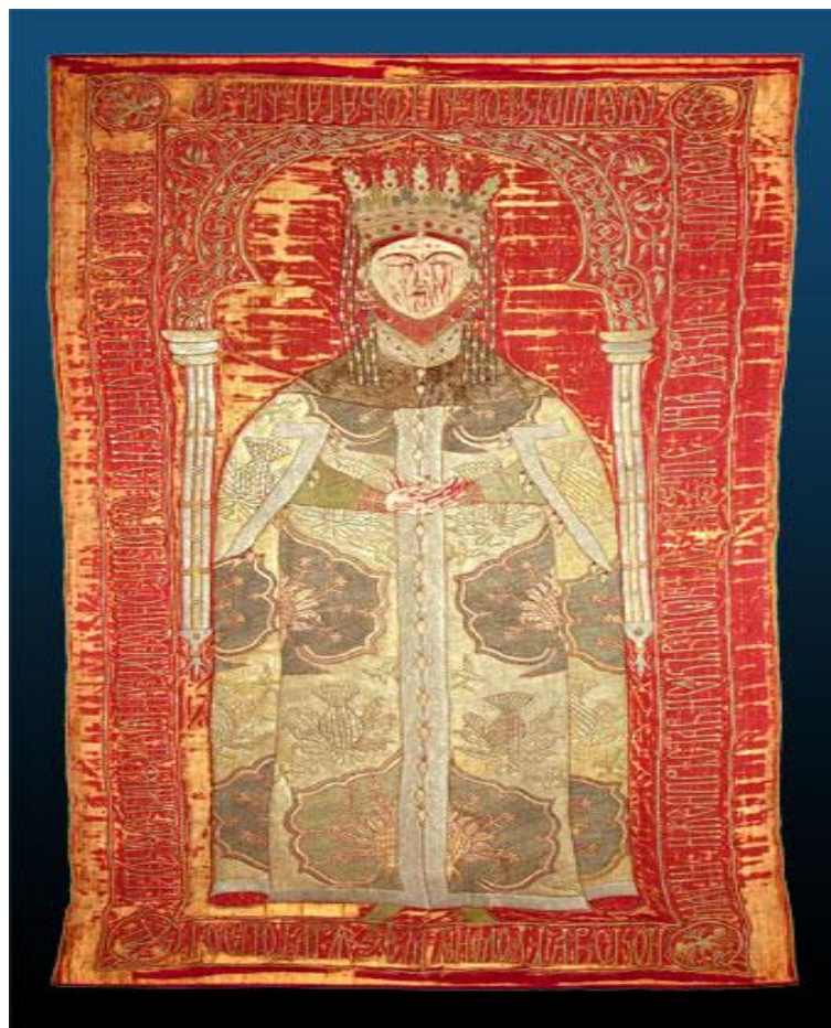
Fig. 7. Acoperământul de mormânt al Mariei de Mangop (Mănăstirea Putna). Mod de acces: https://www.putna.ro/Acoperamant-mormant-s3-ss1-c4-cc1.php