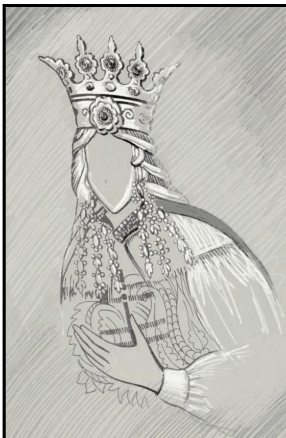
Fig. 5. Înelitoarea capului Mariei Voichița, detaliu din pictura de la Voroneț [4]