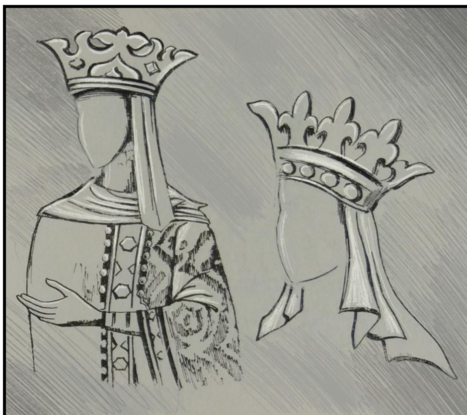
Fig. 4. Invelitoarea capului doamnei Ana și a Mariei Voichița. Secolul al XV-lea) [4]