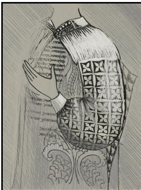
Fig. 3. Broderia cămășilor purtate de Maria Voichița. Sfârșitul secolului al XV-lea [4, p. 51]