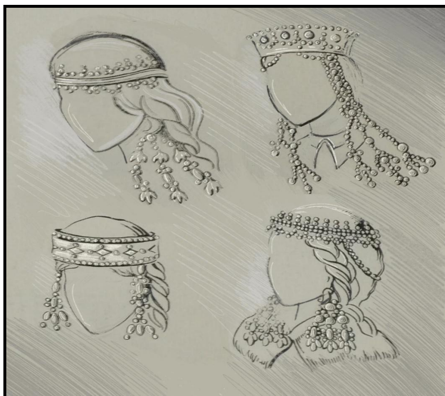
Fig. 6. Diademele purtate de tinerele domnițe și jupanițe din secolul al XV-lea în Moldova [4]