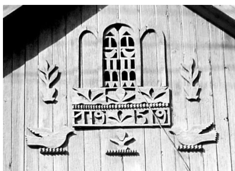
Fig. 9. Fronton cu lucarnă. or. Comrat.