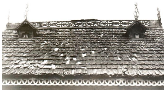
Fig. 3. Acoperiș cu lucarne. s. Larga (Briceni).

În Moldova deosebim două tipuri de acoperiș: în două ape și în patru ape. Acoperișul în două ape are două versante închise cu frontoane de formă triunghiulară. Acest tip de acoperiș este răspândit parțial în zona de centru, dar mai ales în sudul Moldovei. Muchia superioară formează coama acoperișului, pe creasta căruia uneori apar elemente decorative numite popular „ciocârlani”, nominalizați deseori în literatura de specialitate: „Acoperișul caselor vechi era foarte înalt, avea coamă scurtă, marcată de „țepe” ascuțite și de „ciocârlani” de șindrilă” [2, p. 33]. Ulterior aceste elemente au fost înlocuite de o scândură traforată, iar la extremitățile acesteia apar așa-numitele „bolduri”.