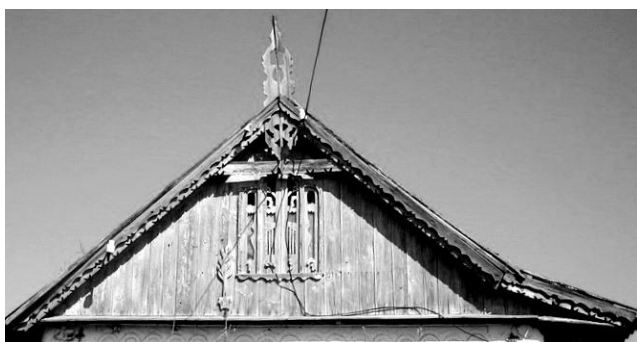
Fig. 1. Fronton de formă triunghiulară. s. Chircăieștii Noi (Căușeni).

Acoperișul este format din șarpantă și învelitoare. În arhitectura populară, șarpanta constituie spațiul numit „podul casei”. Învelitoarea poate fi alcătuită din diferite materiale: șindrilă, țiglă, tablă etc. Ea este destinată să acopere spațiile din interior și să protejeze construcția de intemperiiile naturii.