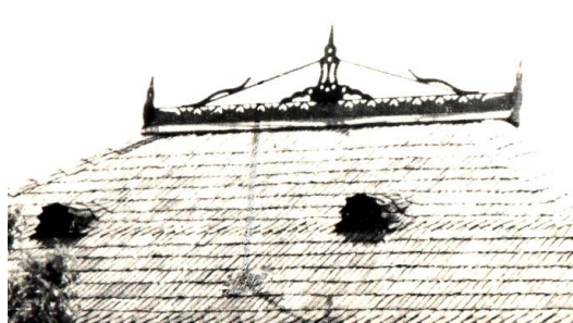
Fig. 4. Acoperiș cu lucarne în semicerc. s. Logănești (Hâncești).