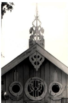
Fig. 5. Fronton cu lucarnă. or. Căinari.