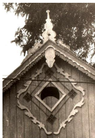
Fig. 6. Fronton cu lucarnă. s. Chircăieștii Noi (Căușeni).