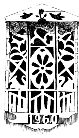
Fig. 10. Lucarnă. s. Crihana Veche Foto V. Malcoci.

La rândul său, timpanul frontonului, încadrat de cornișe bogat profilate, este la fel frumos împodobit cu imagini ale Pomului vieții, figuri zoomorfe și simboluri solare. Ele sunt structurate, expuse în compoziții logice, manifestând diferite concepții și structuri mitofolclorice din cultura românească.