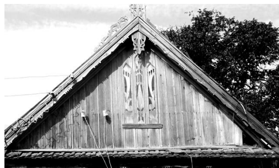
Fig. 2. Fronton de formă triunghiulară. or. Taraclia.

Componenta ce întregește ansamblul compozițional al acoperișului este cornișa streășinei. Este un element ce reprezintă o scândură sculptată sau traforată, așezată pe orizontală, imediat sub streășina acoperișului. De rând cu rolul decorativ pe care îl deține, cornușa are și menire funcțională, servind la îndepărtarea apelor pluviale. Deseori acest detaliu este numit de către meșterii populari „scândură lată” sau „horboțică”.