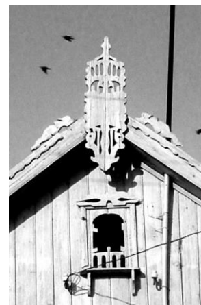
Fig. 7. Fronton cu lucarnă. or. Comrat.

Ultima imagine ce face parte din simbolurile solare este calul. Acest animal a fost puternic mitologizat în tradiția populară românească și în simbolistica universală. În tradiția românească, acest animal deține o importantă funcție de apărare împotriva tuturor relelor. Astfel, siluetele de cai sau capete de cai sunt plasate la frontoane sau pe boldurile caselor, îndeplinindu-și funcțiile apotropaice.