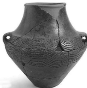
3. Vas din cultura Bonu Ighin