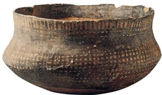
Figură 2. Vas Tell Sabi Abyad Figură

Decorul unicat în puncte a fost descoperit și pe obiectele de ceramică din perioada neolitică. Specificul ceramicii din aceasta epocă este confirmat de ornamentele incizate și excizate, organizate într-unul sau mai multe registre cu un decor linear realizat cu ajutorul canelurilor, spiralelor, volutelor, uneori îmbinate cu triunghiuri și dreptunghiuri geometrizate, cu proemințe punctiforme (Fig. 2, 3, 4, 5).