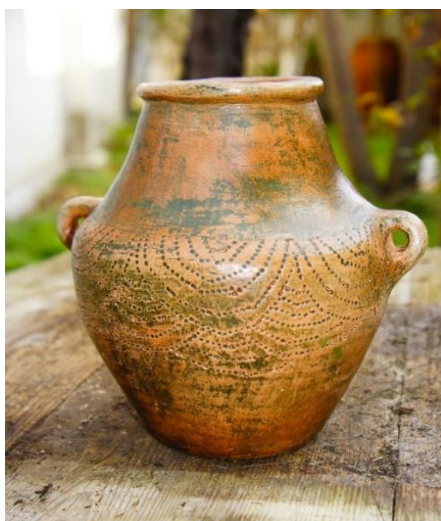
Figură 4. Vas bitroncoconico, cultura Ozieri Figură 5. Oală, neolitic. San Cosimo