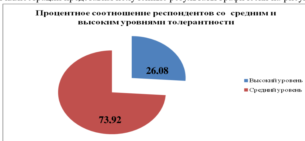
Рис. 1. Процентное соотношение респондентов со средним и высоким уровнями толерантности

Для иллюстрации представим полученные результаты графически на рисунке 1.