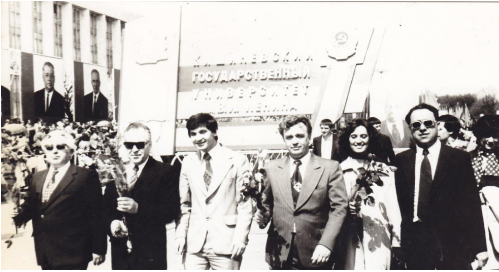
La o demonstrație de 1 mai. Chișinău, 1983.