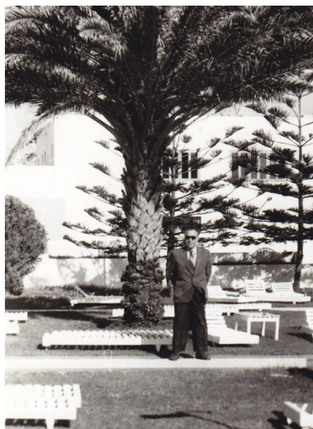
În Algeria, 1983.