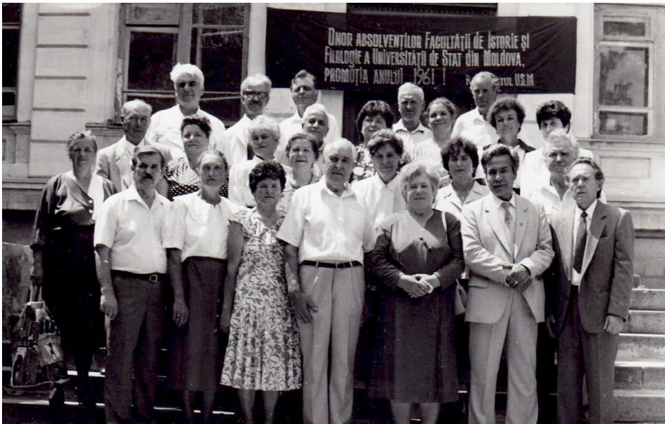
Întâlnire cu absolvenții Facultății de Istorie și Filologie, promoția anului 1961. Foto: 2001.