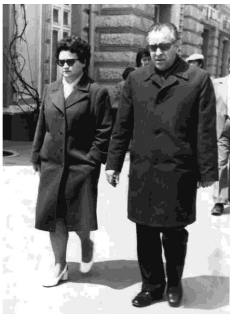
La o promenadă cu soția în centrul Chișinăului, 1978.