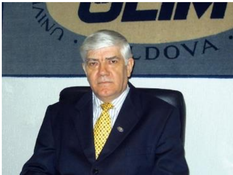
Rectorul ULIM Andrei Galben.

În 1992 Andrei Galben fondează Universitatea Liberă Internațională din Moldova (ULIM), cunoscută departe peste hotarele țării. Implicarea sa activă în reformarea sistemului învățământului superior, prin deschiderea de noi oportunități educaționale, a făcut ca mulți tineri să-și realizeze visul de a îmbrățișa o profesie prestigioasă.